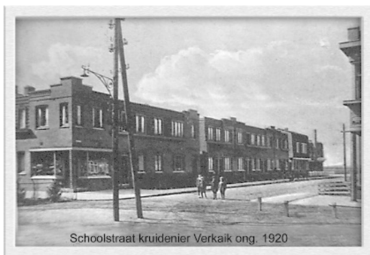
Afb. 3. De Korenbloemstraat, vroeger Schoolstraat of ook wel Spoorstraat, naar het spoor in de verte.