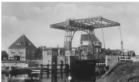
Afb. 4. De oude Duivendrechtse brug, afgebroken in 1987.