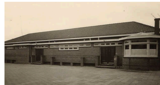
Afb. 9. d'Oude School, gebouwd als Christelijke lagere school, met zijn oorspronkelijke strakke uiterlijk.