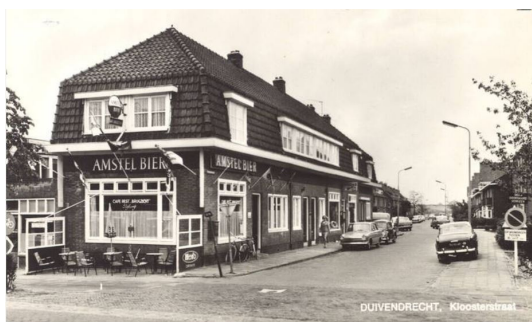
Afb. 5. Voormalig cafe Brugzicht.