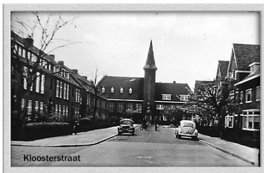
Afb. 6. Het Clarissenklooster, jaren-60.