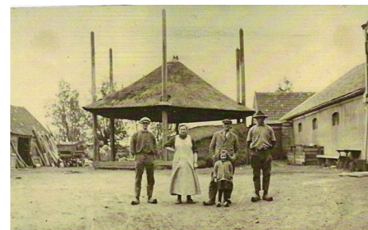
Afb. 8. Het erf van de boerderij Groot-Giessenhof, rond 1930.