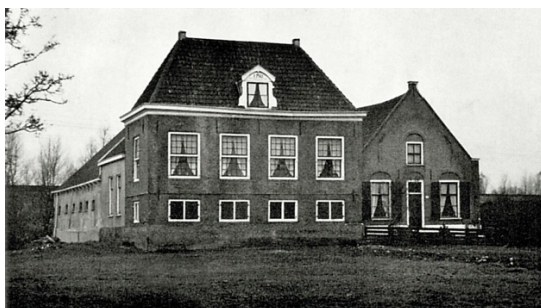
Afb. 2. Boerderij Strandvliet, uit 1750. Hier loopt nu de metro naar Gein.