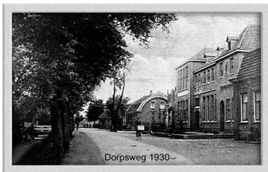
Afb. 1. De Rijksstraatweg waar nu het station ligt.