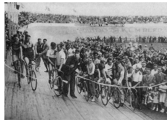
Afb. 7. De Veka wielersbaan. Er werden ook bokswedstrijden gehouden. En politieke bijeenkomsten, die vaak uitmondten in rellen.