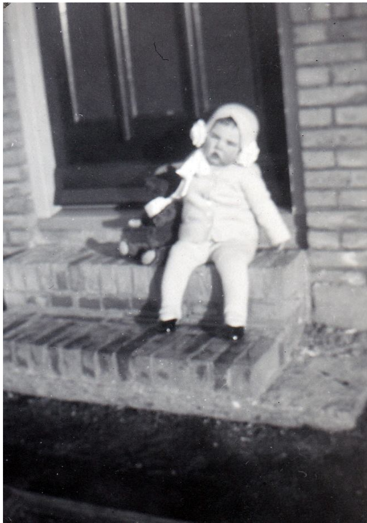
En hier zit ik als 1-jarige op de stoep van ons huis aan de Diemerlaan.