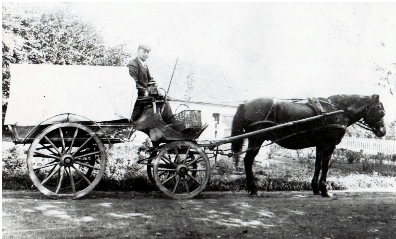
In de zomermaanden trok mijn Opa Feddema met deze pilskar door de weilanden om de dorstige boeren, die daar op het land werkten, van bier te voorzien.