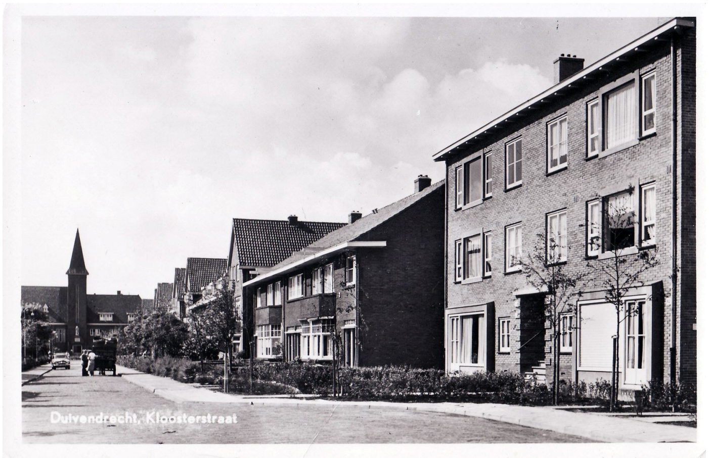
Van de Rijksstraatweg verhuisden ik met mijn ouders naar de Kloosterstraat nummer 32