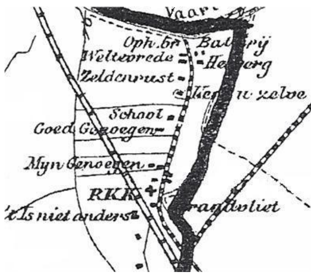
Deel van Duivendrecht op een kaart uit 1896.