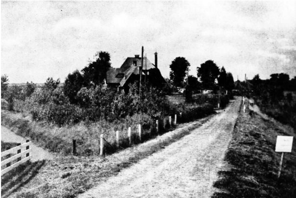
Foto: Het clubhuis van de golfclubs kort na de bouw in 1934. Rechts het Zwarte Laantje met in de verte de boerderijen, die er toen nog aan lagen. Aantekening achterop de foto: "Clubhuis der Amsterdamsche Golfclubs te Duivendrecht - Architect. F.A. Warners, gebouwd 1934."

Het gehele gebied maakt deel uit van de Amstelscheg en wordt doorsneden door Rijksweg 2 en Rijksweg 9. Het zuidelijk gedeelte van de Groot Duivendrechtsepolder en de gehele Klein Duivendrechtsepolder hebben een hoofdzakelijk agrarische karakter, maar ook een belangrijke recreatieve bestemming. Er bevinden zich er onder meer golfbanen, sportvelden, volkstuinen en fiets- en wandelpaden.