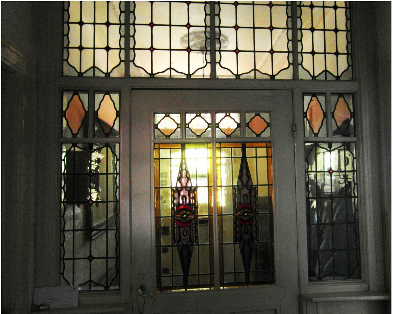
De vestibule ademt de sfeer van destijds