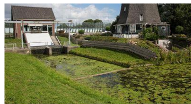
Het nieuwe gemeaal naast de oude molen. Op de achtergrond het geluidsscherm van de A10.

De grootte van de tuin achter Molenkade 29 is van boven af goed te zien. En aan het eind van de Molenkade de molenstomp van de Vensermolen. De Vensermolen, de molen van Portengen, staat langs de Weespertrekvaart aan het einde van de 500 m lange Molenkade, net in Diemen. Door de eeuwen heen heeft hier een reeks van molens gestaan. Rond 1900 stond hier slechts een molen en een enkele landarbeiderswoning. De Molenkade is nu een gebied met nijverheid en woningen vlak bij elkaar.