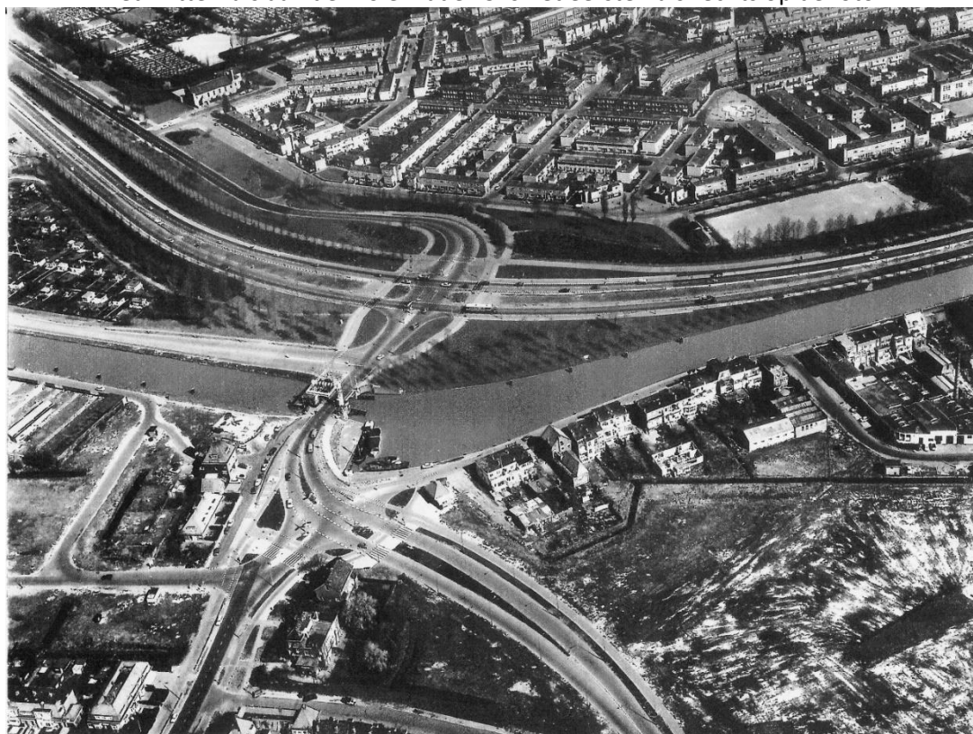
Een luchtfoto van april 1970 uit archief van de SOD: De Duivendrechtse brug over de Weespertrekvaart. In het noorden ligt Betondorp. Via de brug reed je de Rijksstraatweg van Duivendrecht binnen. Rechts aan het water liggen de woonhuizen en bedrijven aan de Molenkade.