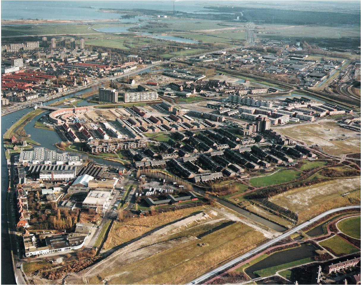
Luchtfoto uit 2013 (SOD) Links het water van de Weespertrekvaart en het witte huis met grote tuin.