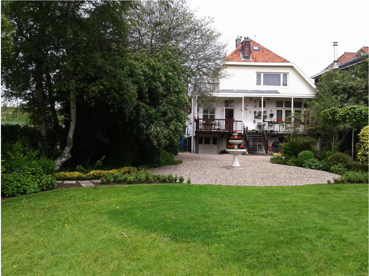
De achterzijde van de woning