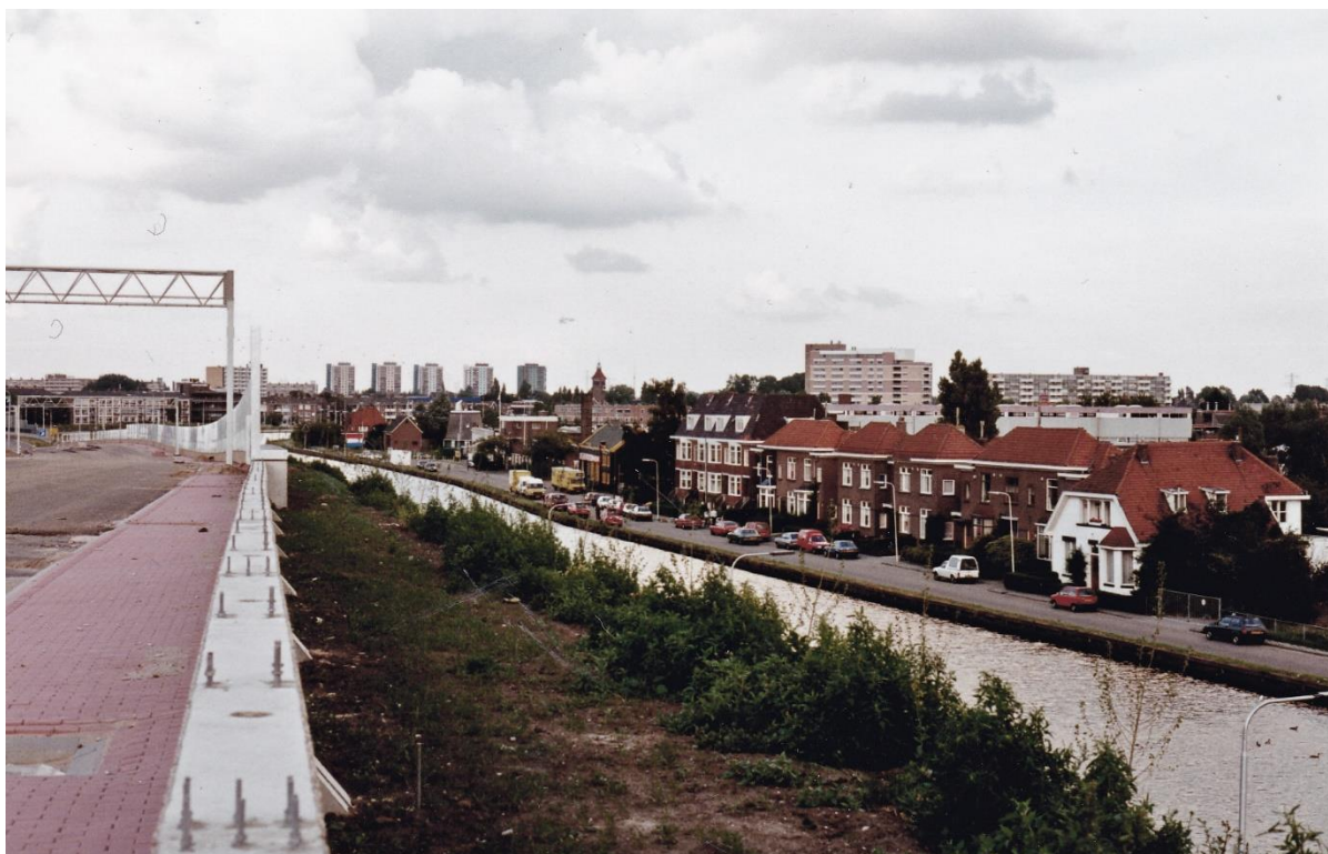
Molenkade gezien vanaf de Ringweg in aanleg in juli 1990. Het Witte Huis aan de Molenkade 29 is het eerste huis rechts op de foto.