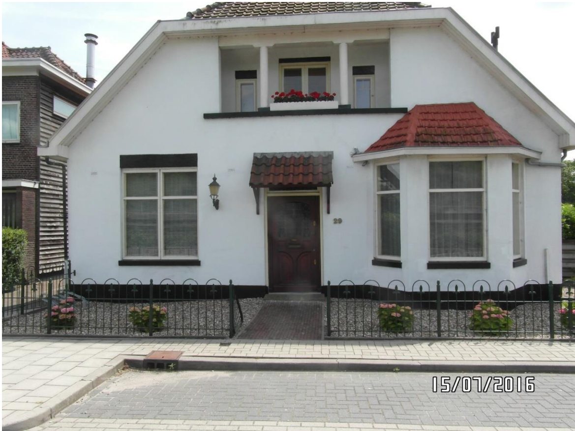
Het 'landhuis' gebouwd in 1921 heeft het originele uiterlijk behouden.