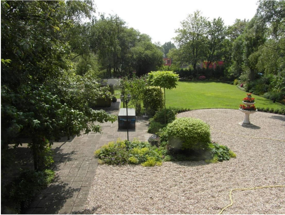
De tuin achter het Witte Huis aan de Molenkade