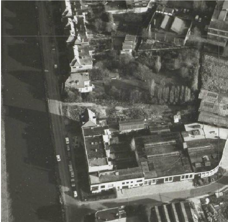
De eerste luchtfoto van het eerste deel Molenkade met huis en tuin van nr. 29 herkenbaar.