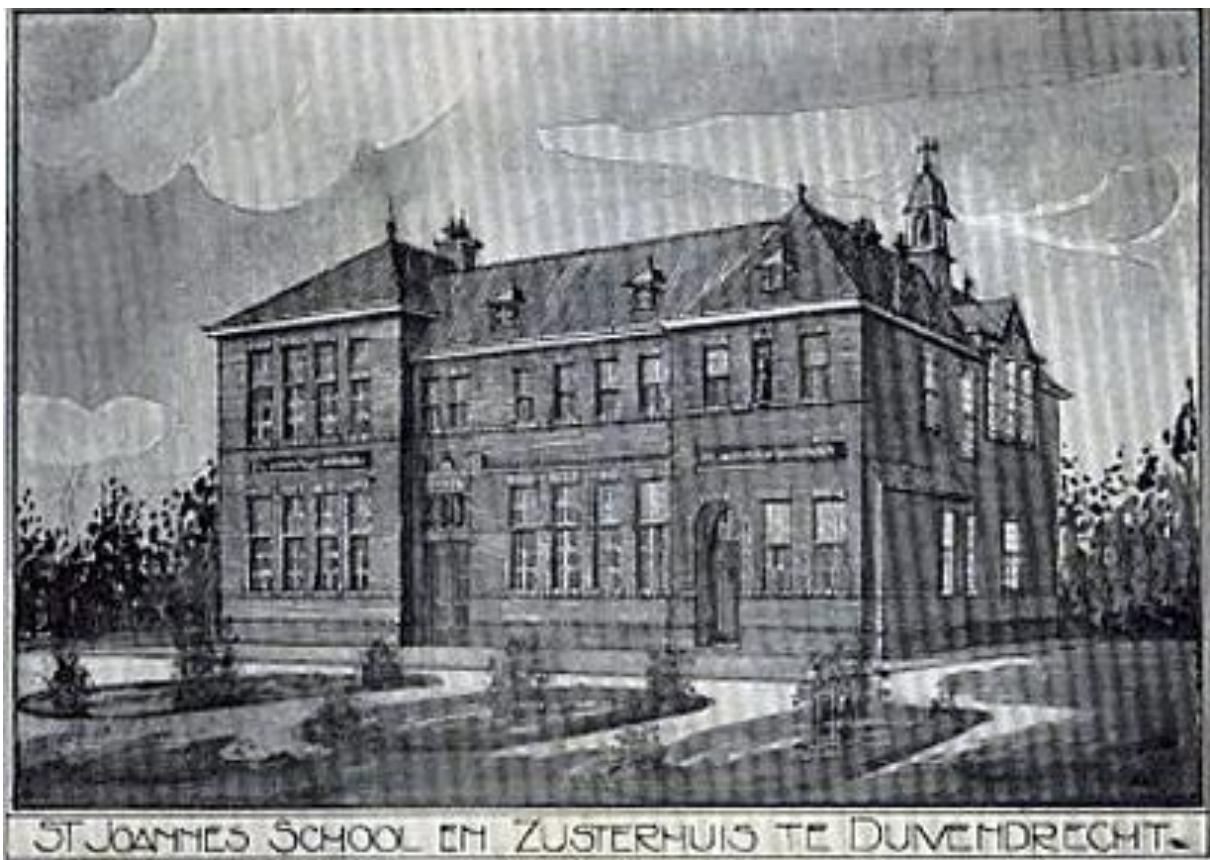
Teekening van de Sint Joannes-school en Zusterhuis te Duivendrecht

Te weinig rekening werd gehouden met de uitbreiding van Duivendrecht wat betreft het Zusterhuis