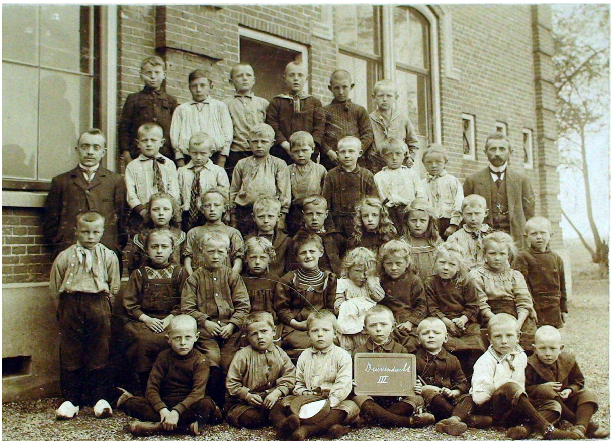
Groep III Openbare lagere school aan de Rijksstraatweg. Schooljaar: onbekend