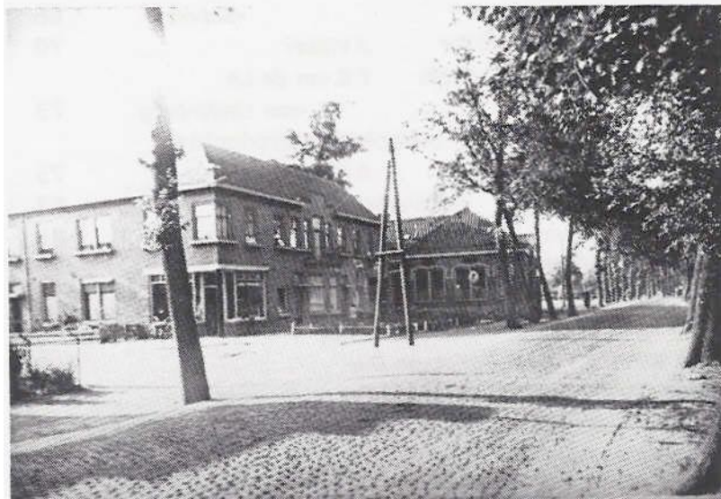
Het gebouw van de openbare school te Duivendrecht lag tegenover waar nu De Kleine Kerk staat Links de vroegere Spoorstraat, nu Korenbloemstraat