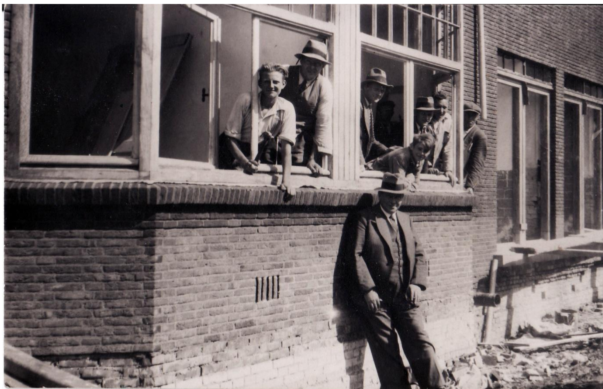
Ons woonblok in de Kloosterstraat in aanbouw (1935)