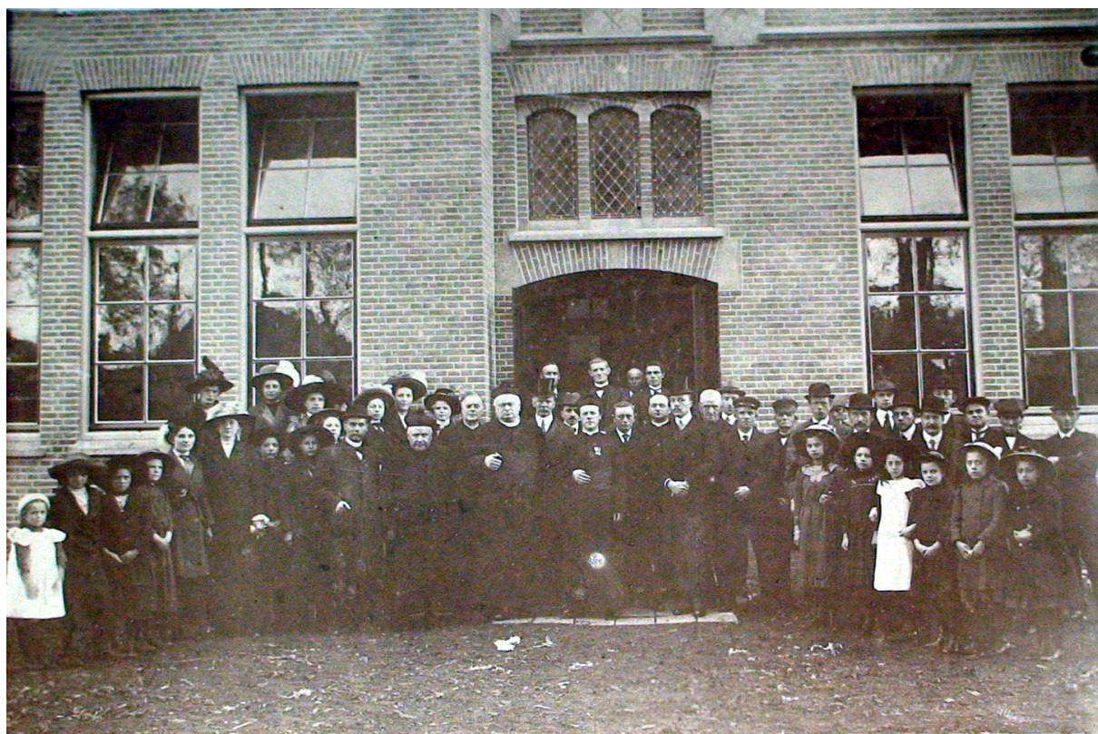
Het schoolgebouw en het klooster zijn door de geestelijken plechtig ingewijd.