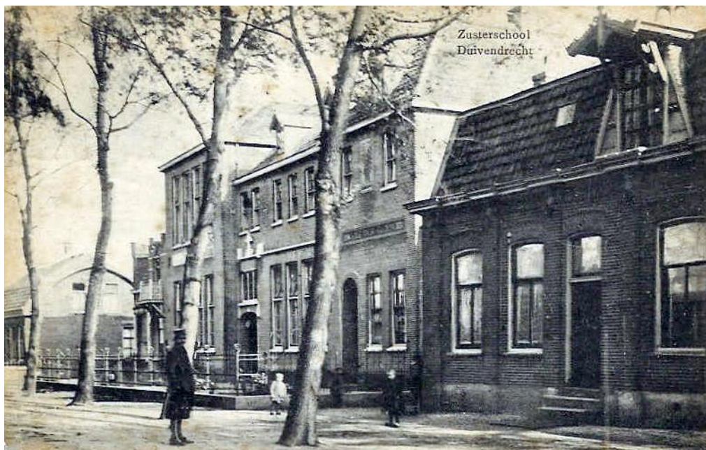
De oudste foto van de Sint Joannesschool en het klooster Soli Deo Gloria De Duivendrechtse Laan ( later:Rijksstraatweg) met de hoge bomen.