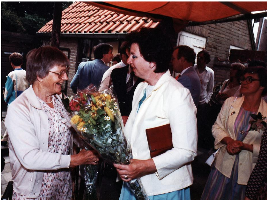
Archief Stichting Oud-Duivendrecht

Doch als we ervaren, en daardoor weten, dat de leerkrachten van vandaag met veel zorg en plezier voor de klas staan en dezelfde toewijding bezitten, kunnen wij met een gerust hart de toekomst van onze A.Bekemaschool tegemoet zien. En dat hopen wij van harte!