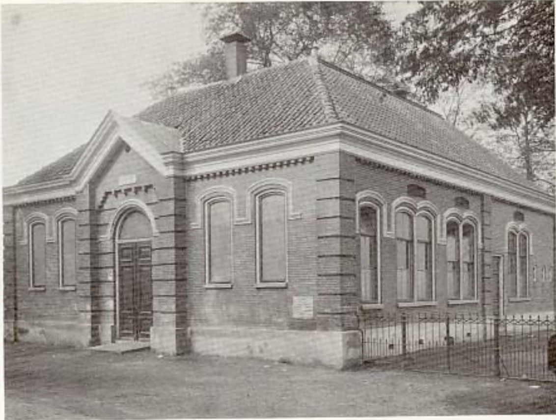
72. Het gebouw van de ± 1920 opgeheven O.L. School te Duivendrecht. Sinds 1925 gebouw "Pax" van de R.K. Welstandsbond Duivendrecht, gesloopt ± 1930. Deze opname dateert uit 1900.

In Duivendrecht is één openbare school. De school wordt bezocht door katholieke en protestante leerlingen. Dat éne schoolgebouw staat aan de Rijkstraatweg aan de even kant, tegenover de plaats waar nu de Kleine Kerk staat.