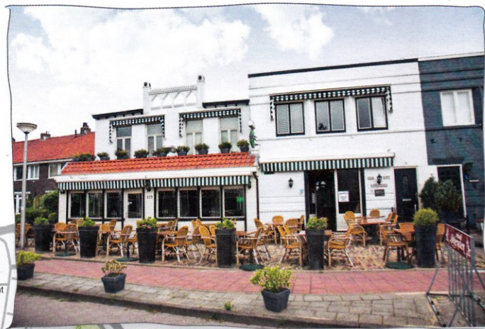
Eetcafé Lotgenoten: lekker eten voor een goede prijs

TIP van Astrid: 'Bij Eetcafé Lotgenoten kun je gezellig en lekker eten en het is niet duur.'