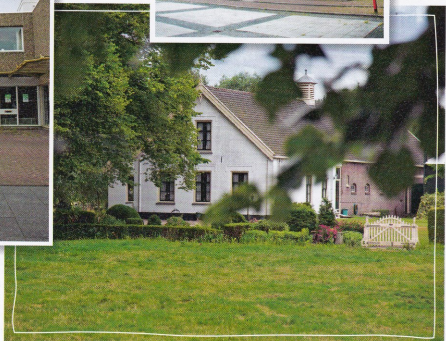
Mijn Genoegen, de enige nog overgebleven boerderij