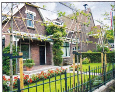
Duivendrecht heeft diverse bouwstijlen