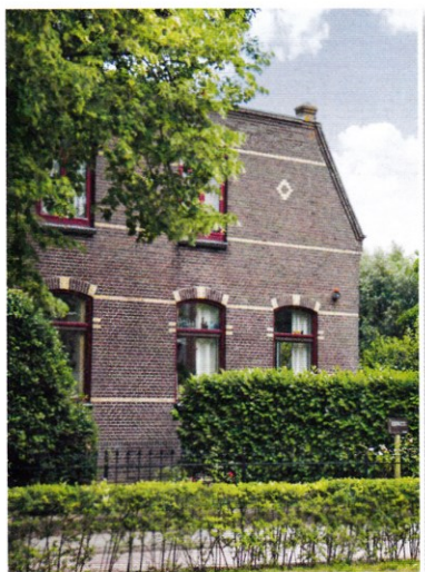
Een van de prachtige panden aan de oudste straat van Duivendrecht, de Rijksstraatweg

TOT 1920 BESTOND DE BEBOUWING VOORAL UIT BOERDERIJEN.