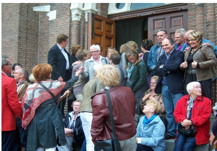
Opstellen voor de groepsfoto leerlingen geboren 1948-1949 voor de RK Kerk te Duivendrecht. 19 september 2010