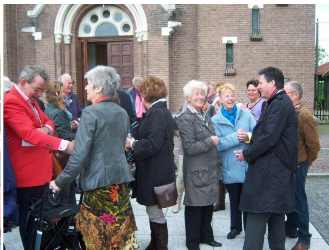
19 september 2010: Reünie Sint Joannesschool van de leerlingen geboren ca. 1948 – 1949. Op het kerkplein voor de RK Sint Urbanuskerk