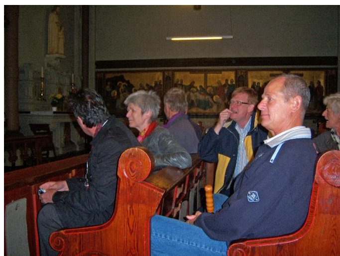
Voor de kerk en in de kerk.