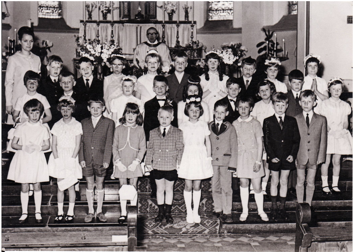
4 mei 1967 De communicantjes op de trappen van het altaar. De voorbereiding op de H. Communie gebeurde op school tijdens de godsdienstlessen door de pastoor en de onderwijzer(es).