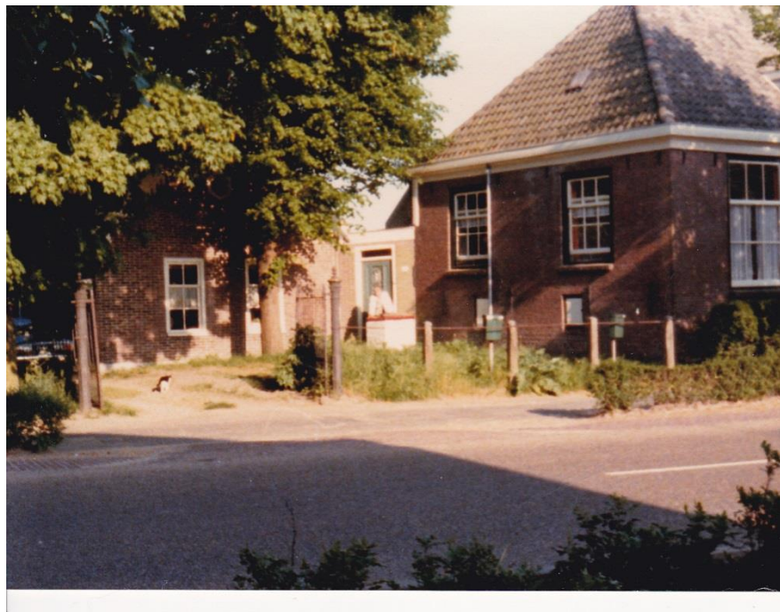
Mevrouw en mijnheer Wim en Fenny Tijsterman-Blok