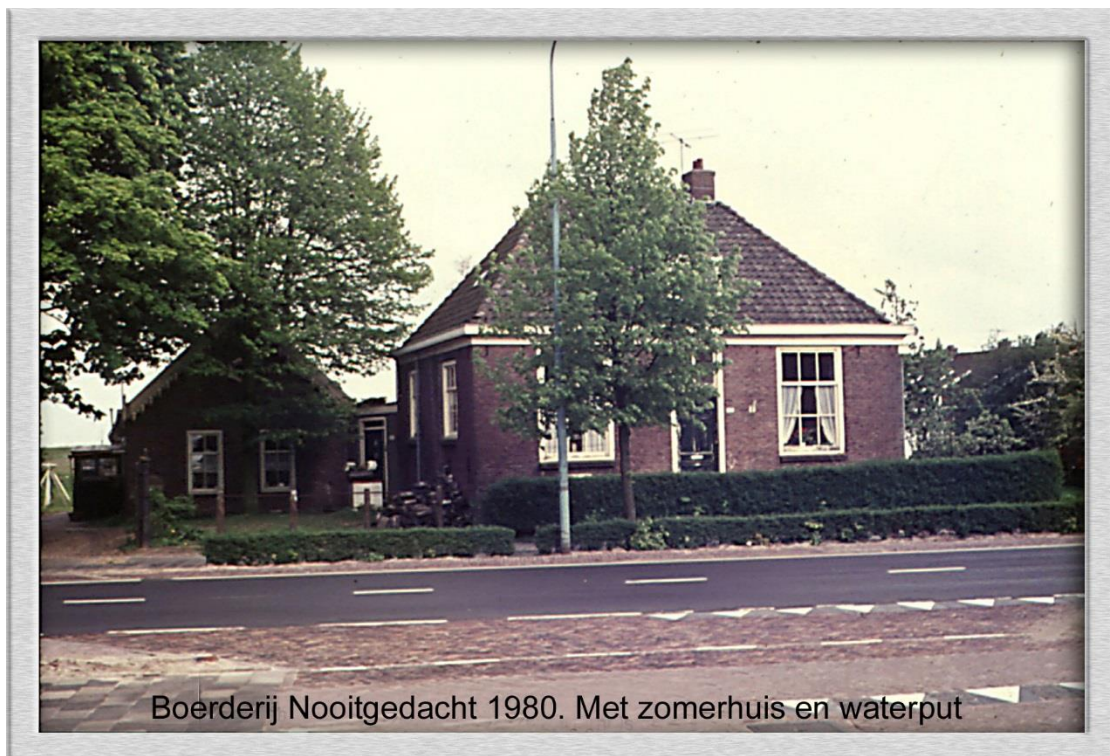
Rijksstraatweg133, tegenover de Korenbloemstraat.

Wij kwamen te wonen in een oude boerderij aan de Rijksstraatweg niet ver van mijn geboortehuis.