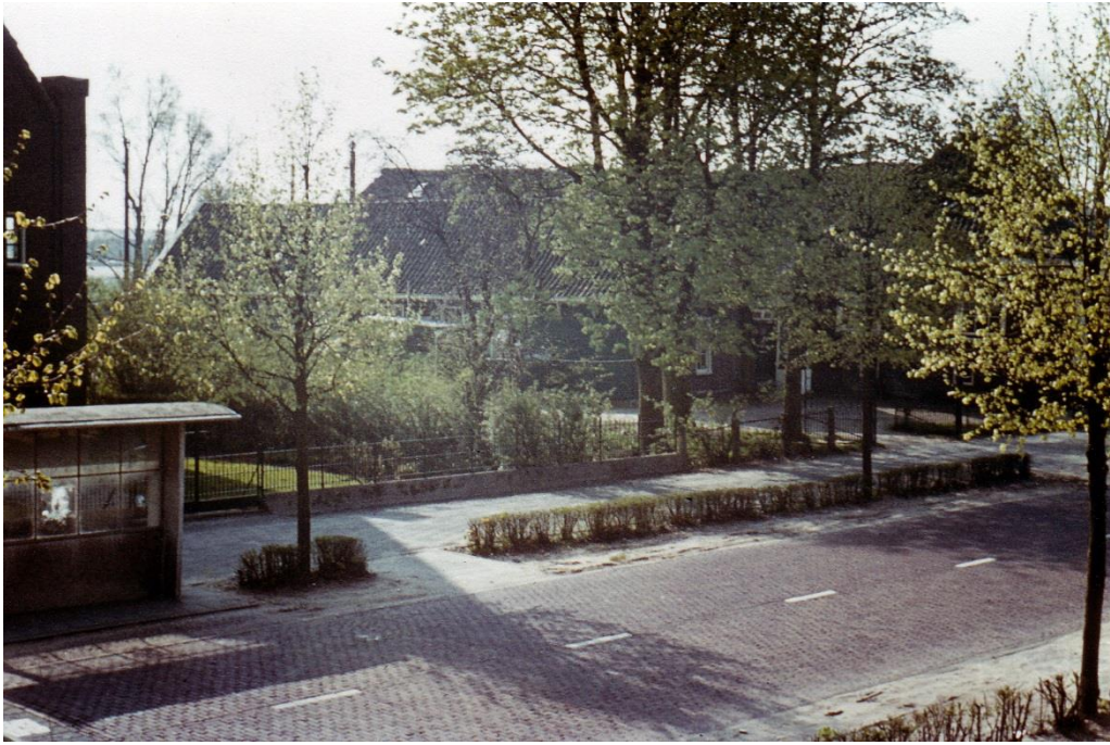
Boerderij Nooigedacht, Rijkstraatweg 133 naast De Nederlands Hervormde Kerk ( nu De Kleine Kerk). De bushalte op die plek is opgeheven