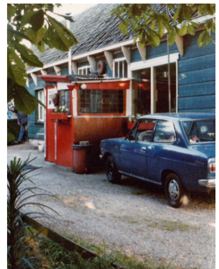
Achter het klompenhok