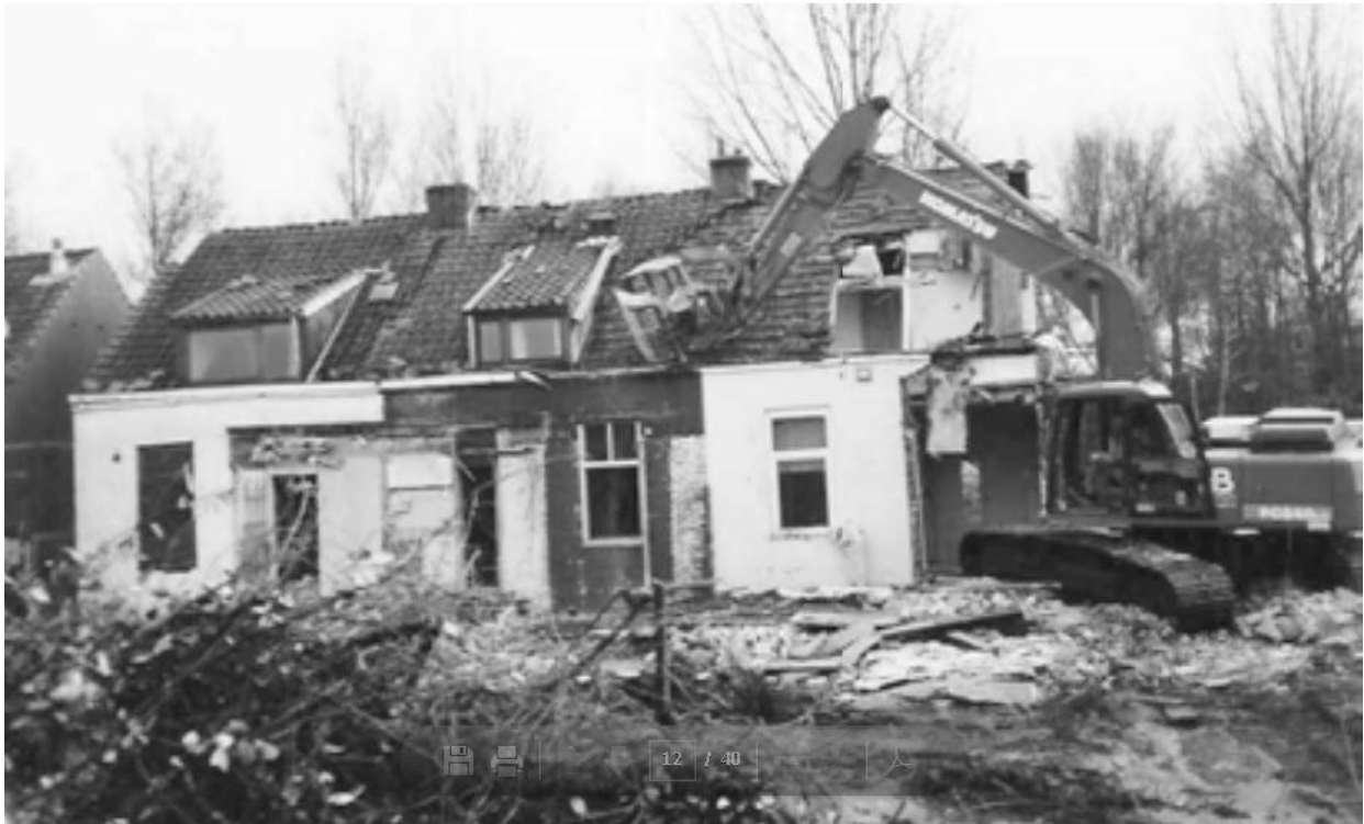
Sloop van de woningen in de Tamarindestraat. Foto: 1976, archief familie Tetteroo

De andere zijde van de Tamarindestraat was al eerder (1976) afgebroken voor de aanleg van de Van der Madeweg, omdat er een verhoogde weg door het dorp moest komen van het metrostation Van der Madeweg tot aan Diemen.