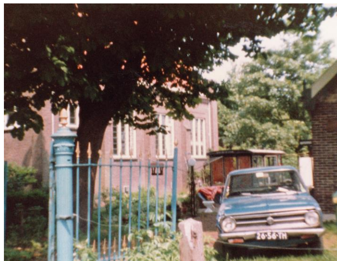
Het zomerhuisje naast de kerk