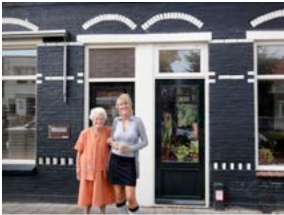
Rijksstraatweg: toen nummers 96,94,92, 90