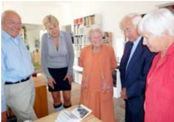
Het verleden komt tot leven