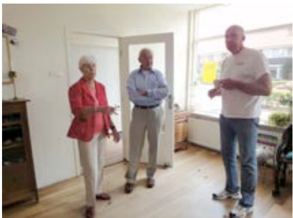
RSW nr. 90 en 92, nu 1 woonhuis nr.216

In de WAAIER in de bibliotheek op het dorpsplein hangen alle foto's van deze dag.