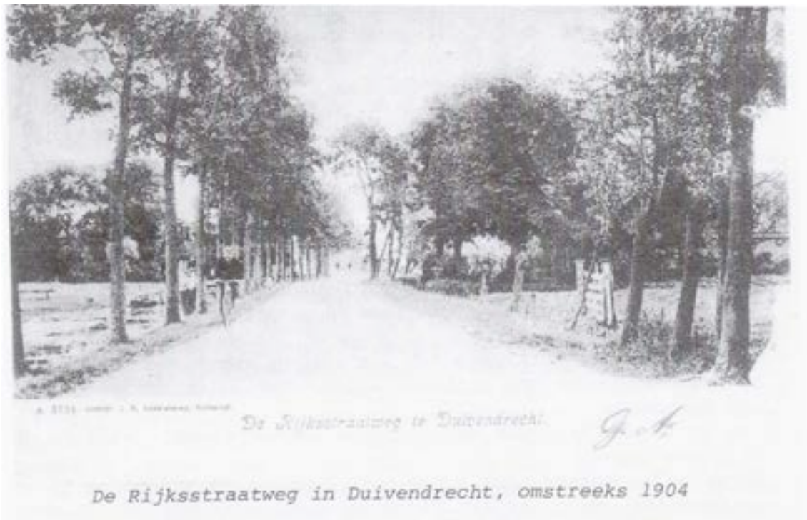
De Rijksstraatweg te Duivendrecht. J. A. H. De Rijksstraatweg in Duivendrecht, omstreeks 1904

Duivendrecht Destijds en Nu, het midden van de Rijksstraatweg