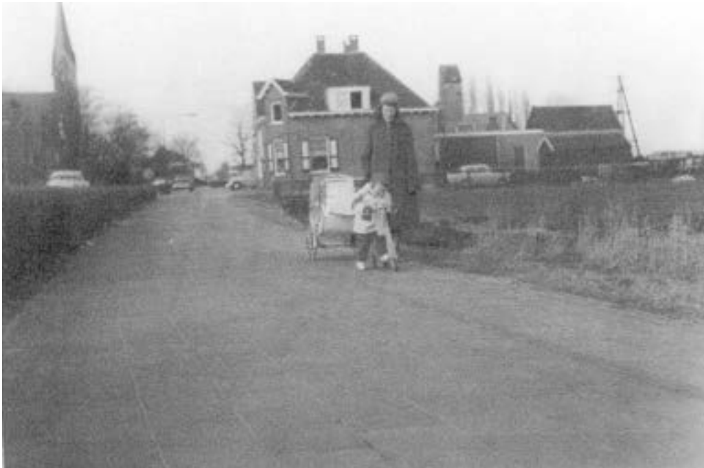
De bocht bij Van Walbeek, de slagerij aan het einde van de Rijksstraatweg. Dochter Bea Toebes ( geb.1961) ligt in de kinderwagen, moeder Alie staat er naast en zoon Geert Toebes ( geb.1959) met zijn autopod!