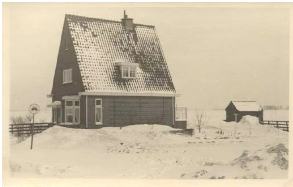
In diezelfde tijd lieten mijn ouders dit huis bouwen aan de Diemerlaan tegenover het café van Spruyt. In april 1933 trokken we er in.

In de jaren dertig werden de sloten gedempt, die langs de straatweg liepen, er kwam een voet- en rijwielpad en de weg werd iets verlegd zodat de bocht bij van Walbeek en Primus minder scherp werd.