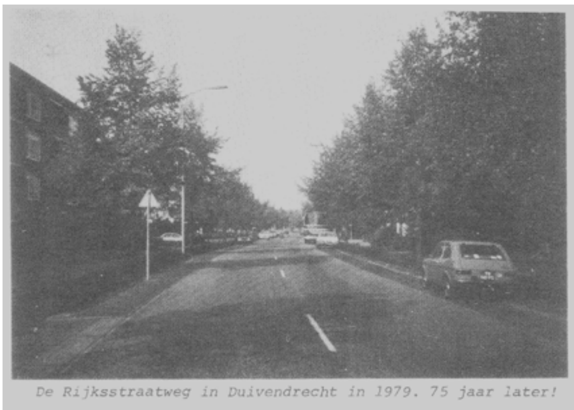
De Rijksstraatweg in Duivendrecht in 1979. 75 jaar later!

Duivendrecht Destijds en Nu, het midden van de Rijksstraatweg