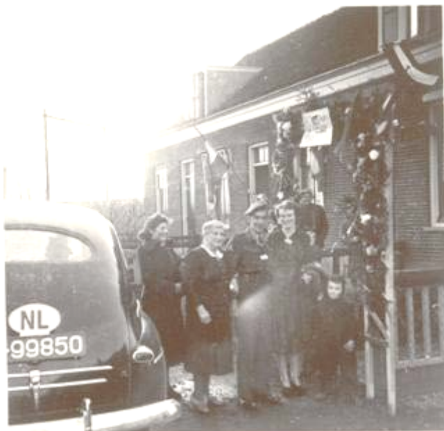
12 januari '50: thuiskomst van mijn verloofde uit de tropen

Motex verdween en mevrouw Nomes kwam er met haar tassenbedrijf. Toen woonde zij met haar man boven de zaak. Een apart deel van het bedrijfspand beneden was ook geschikt als woning. Daar woonde eerst de familie Tuinman en de laatste bewoners waren de familie van Rossum.