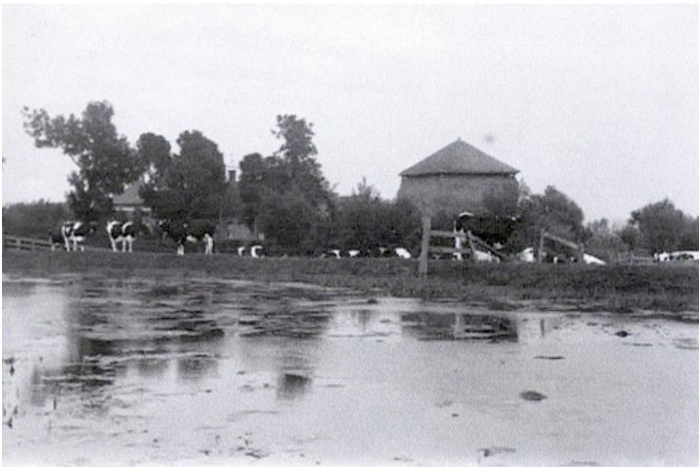
Duivendrecht eind 19 e eeuw

Veel groei zat er niet in Duivendrecht. In 1795 stonden er in totaal slechts 32 à 33 huizen, met circa 160 inwoners.