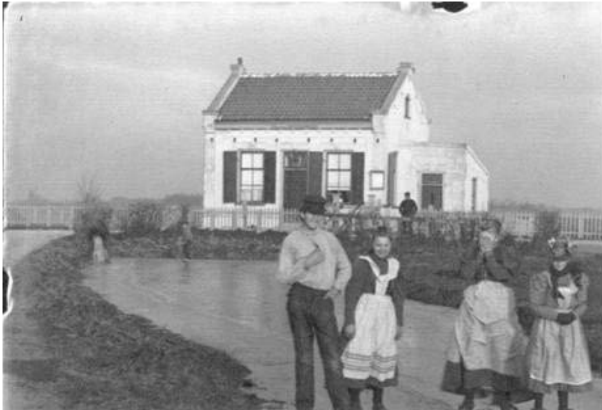
IJspret bij het Tolhuis

Nov.1896, tol, polder Duivendrecht- aan Abcouderstraatweg kruising Diemerlaan.