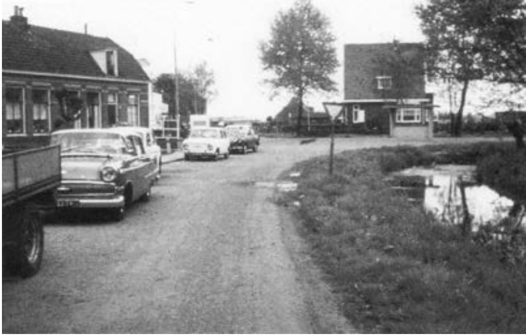
De omgeving van het huis van de familie Smit ( gebouwd in 1933) Het huis werd in 1968 onteigend voor de bouw van de Bijlmer na een procedure met een advocatenkantoor.