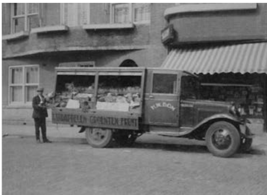
Venten in Amsterdam