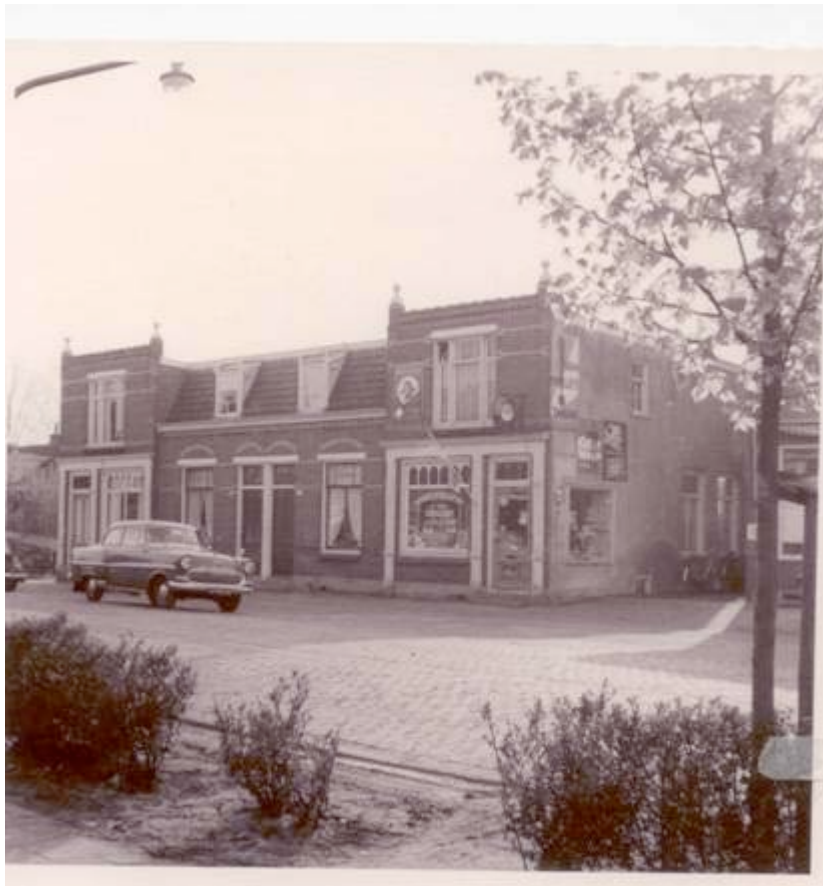
Rijksstraatweg 96, 94, 92, 90 (v.l.n.r. oude nummering) Nu nummer 222 en 216