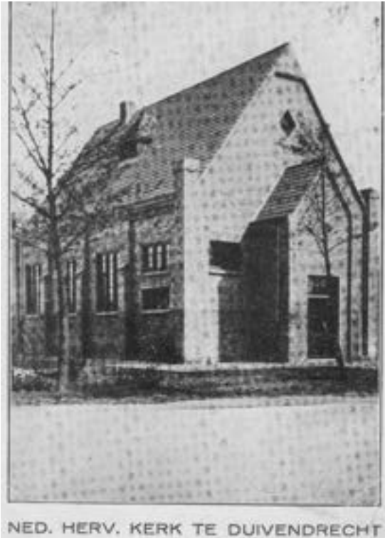
NED. HERV. KERK TE DUIVENDRECHT