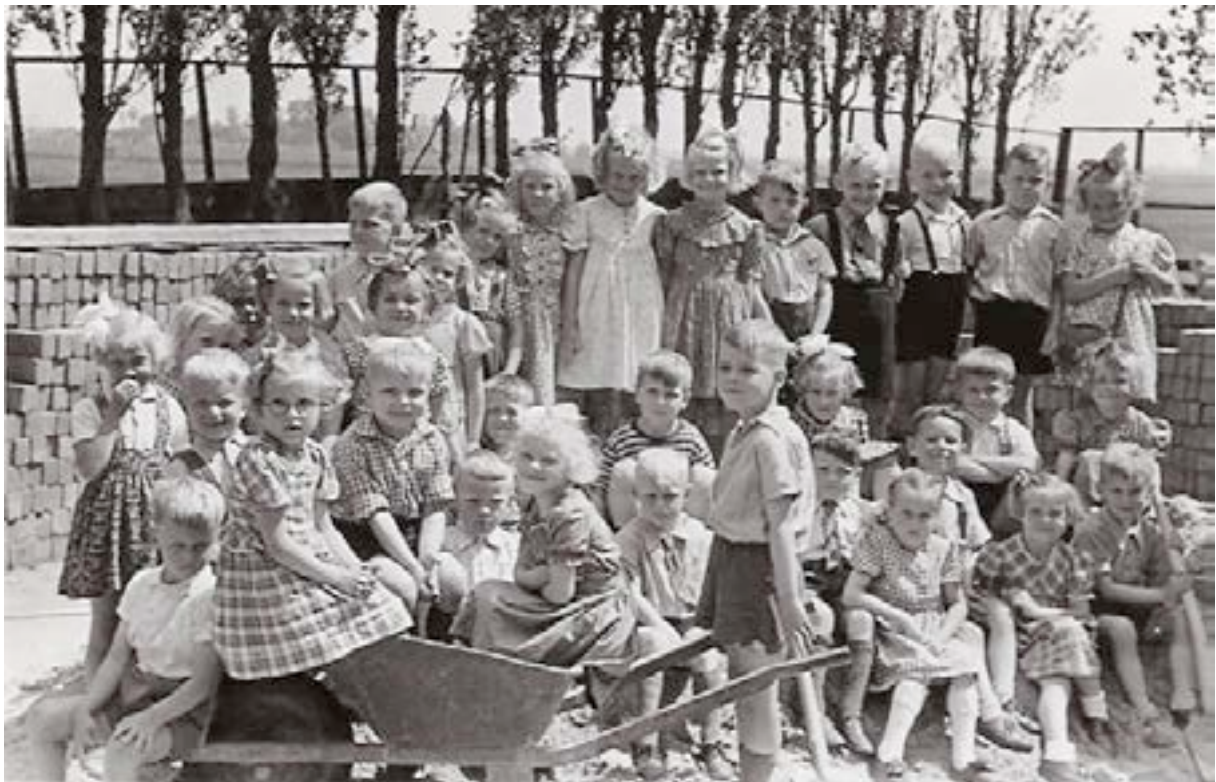
De oudste kleuters

De kleuters van de katholieke kleuterschool: jaren vijftig van de vorige eeuw