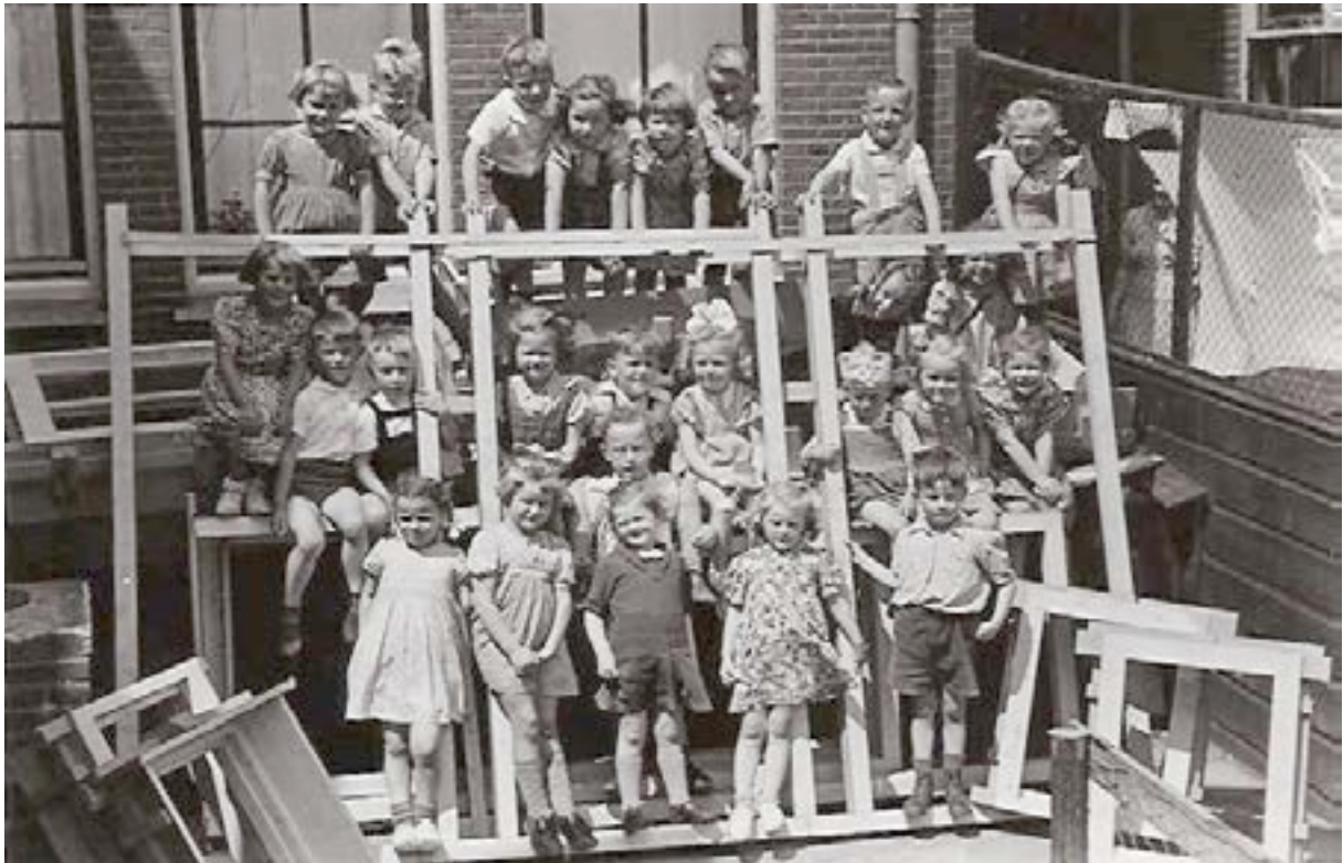
De groep middelste kleuters van de Sint Joannesschool, Rijksstraatweg 233 in afwachting van de nieuwe opbouw. Midden jaren 50.

Pas in 1956 toen de nieuwe kleuteronderwijswet van Minister Cals door de Kamer was goedgekeurd, werd het kleuteronderwijs als volwaardig onderwijs erkend. In deze wet werden voor het eerst financiële en onderwijsinhoudelijke zaken voor het kleuteronderwijs geregeld en kwam er wat het kleuteronderwijs betreft een einde aan de tijd van liefdadigheid. In Duivendrecht breidden de kleuterscholen zich sindsdien ook uit.