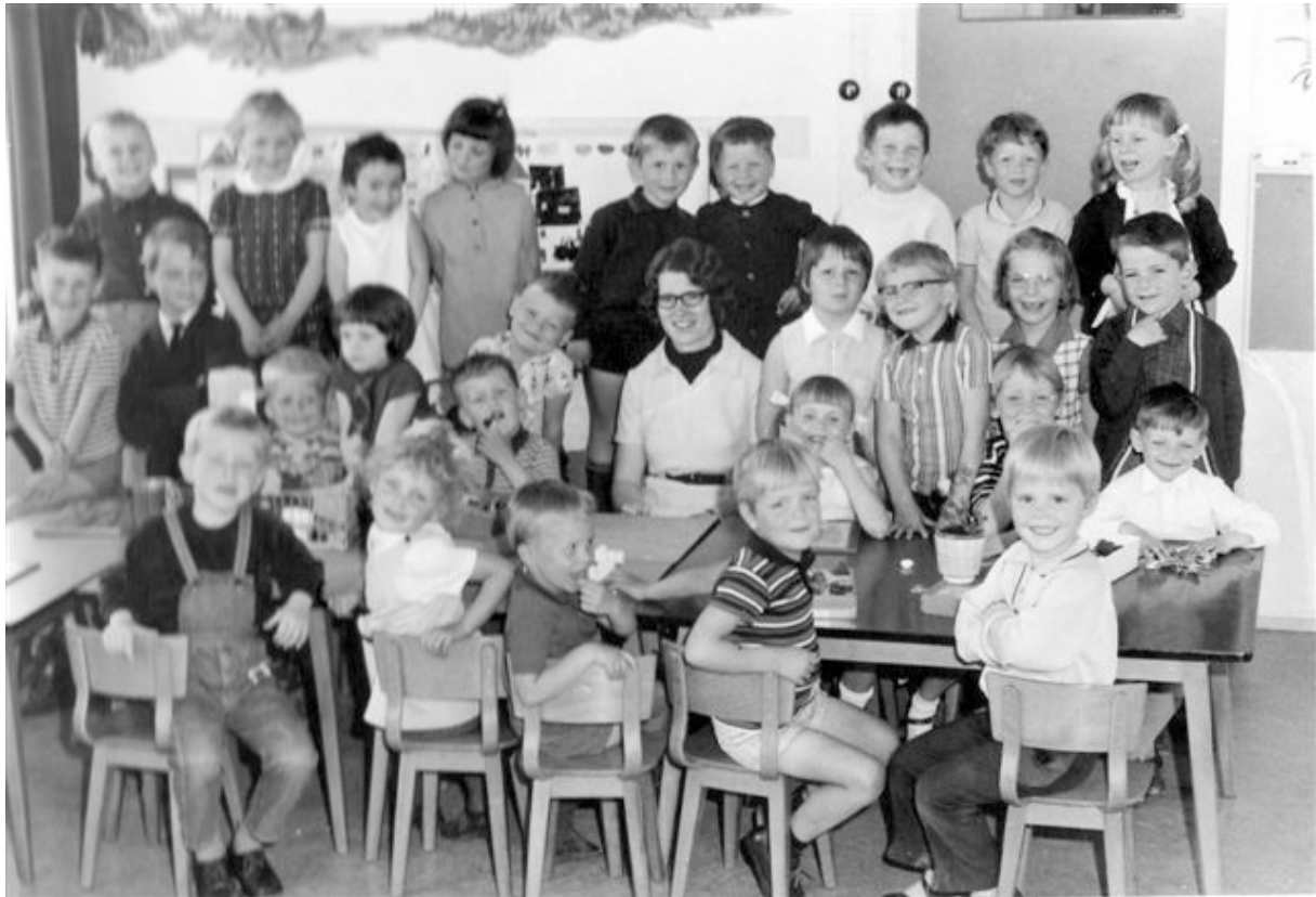
Juni 1969: Christelijk kleuterschool Pippeloentje in De Meidoorn (nu: d'Spot) Uit het fotoboek van Marc Pieneman