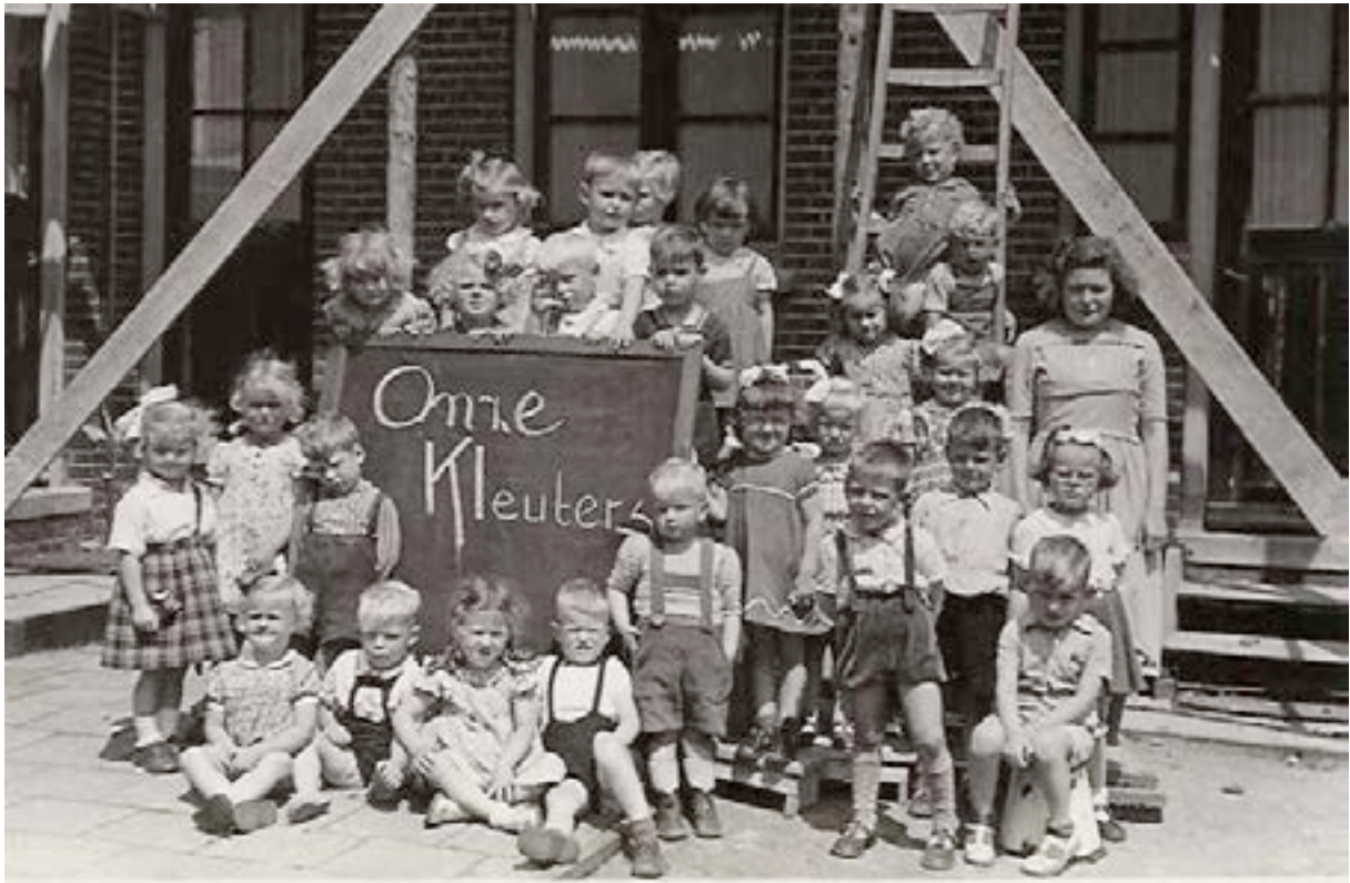
De allerjongste kleuters

De kleuters van de katholieke kleuterschool: jaren vijftig van de vorige eeuw