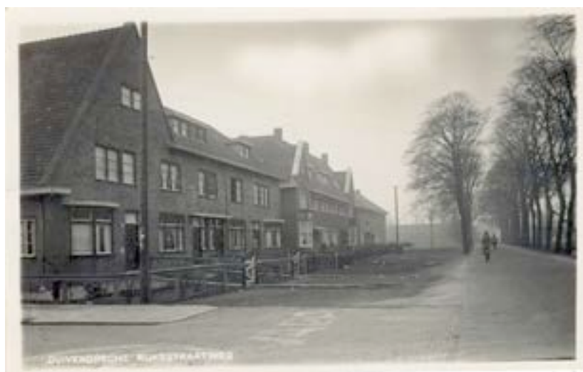
Links Rijksstraatweg nr.49, hoek Burgemeester van Damstraat.