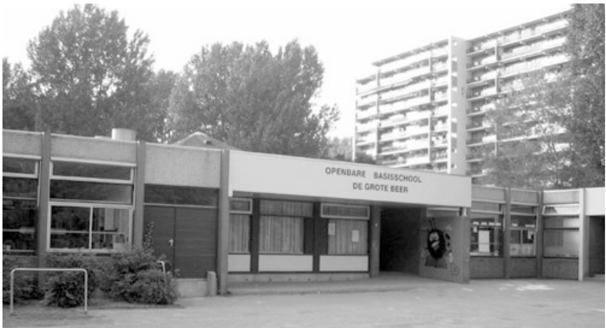
obs “DE GROTE BEER” Zonnehof 1