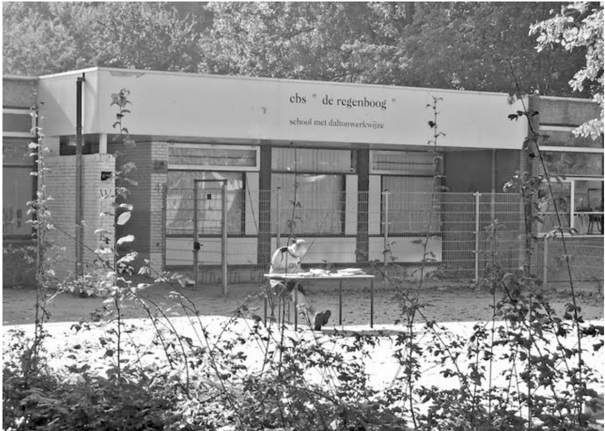
cbs “de regenboog” school met daltonwerkwijze. Zonnehof 4 Laatste werkdagen van een onderwijzer van 'de Regenboog' Duivendrecht