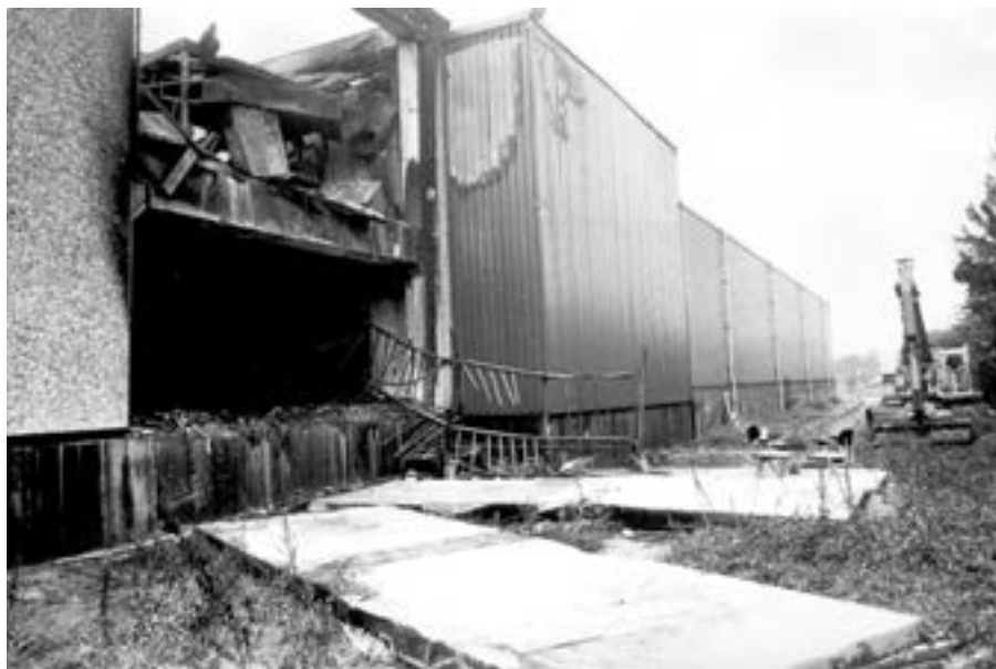
Fikse ravage en gevaarlijke situaties.