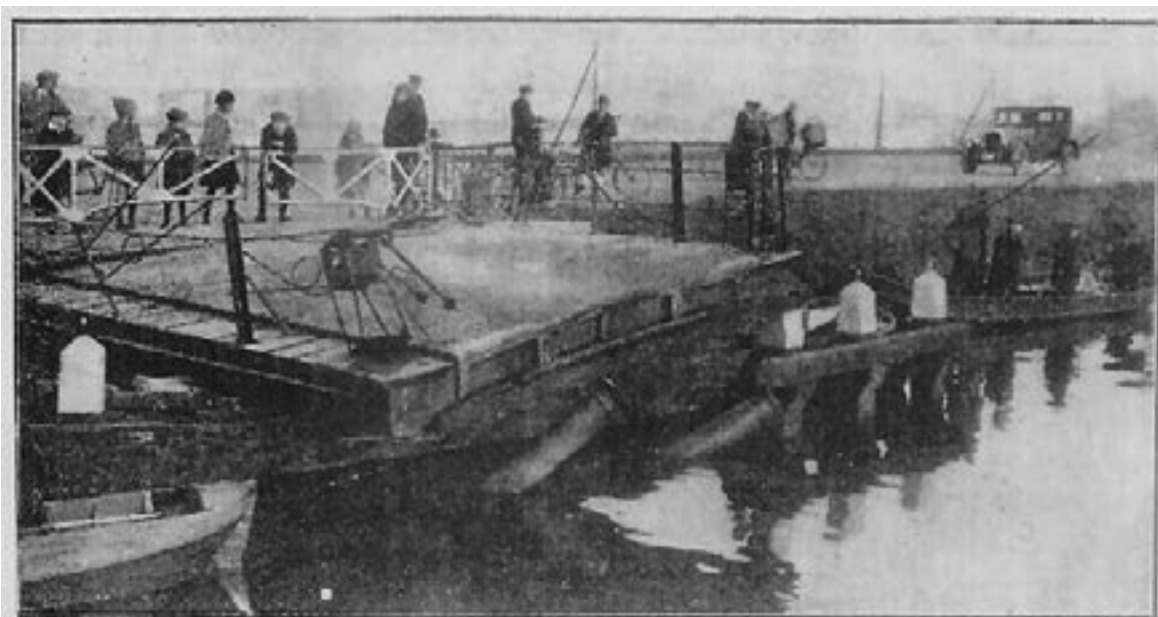
Een brug aangevaren.

Links op deze in ± 1910 genomen foto de Watergraafsmeer, waar in de jaren 1921, de huizen van Tuindorp Watergraafsmeer (Betondorp) zouden worden gebouwd.