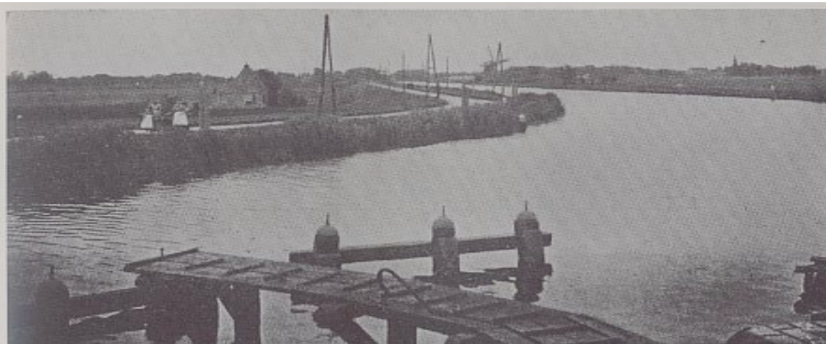
Uitgave P. Rijkema, Duivendrecht.