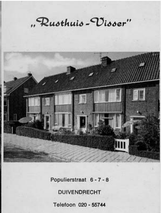
In februari 1967 komen 4 geestelijk gehandicapte ouderen om bij de brand in Rusthuis Visser