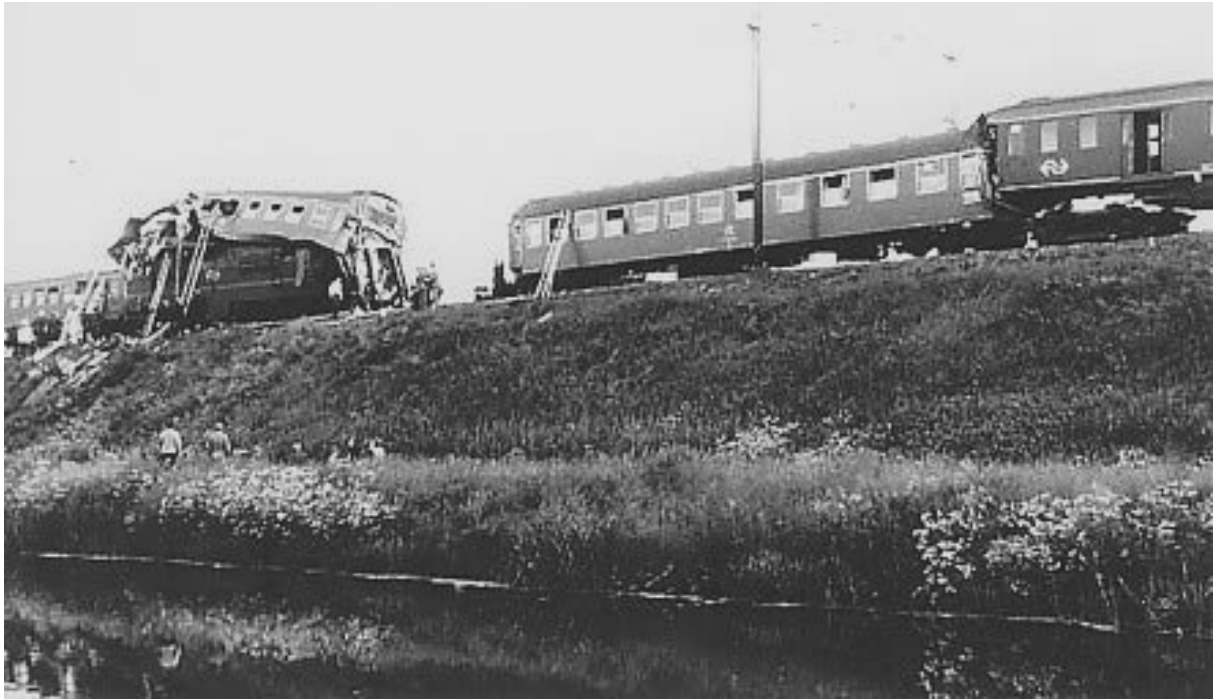
Treinramp Duivendrecht 30 mei 1971