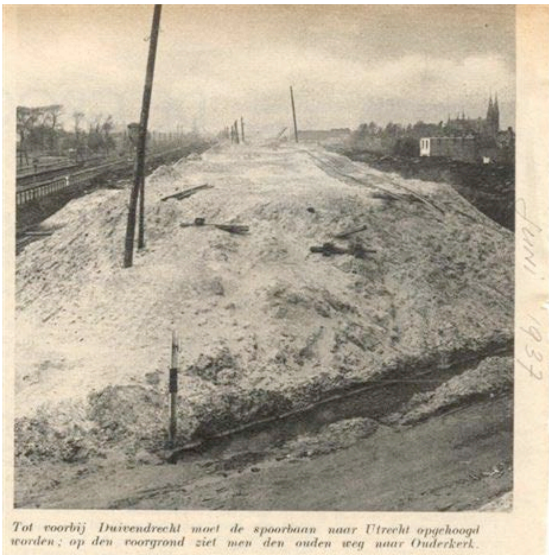
Blad Stad Amsterdam juni 1937