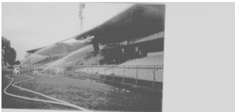
Een brand op de ertribune van het oude Ajax-stadion in de Meer.