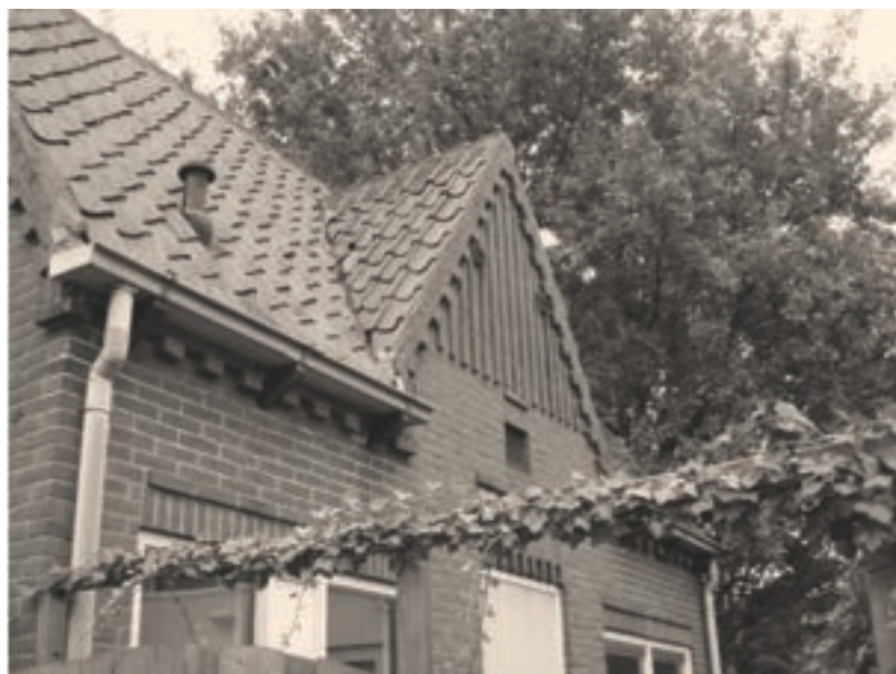
Het nog bewaard gebleven gevangenisje van Duivendrecht