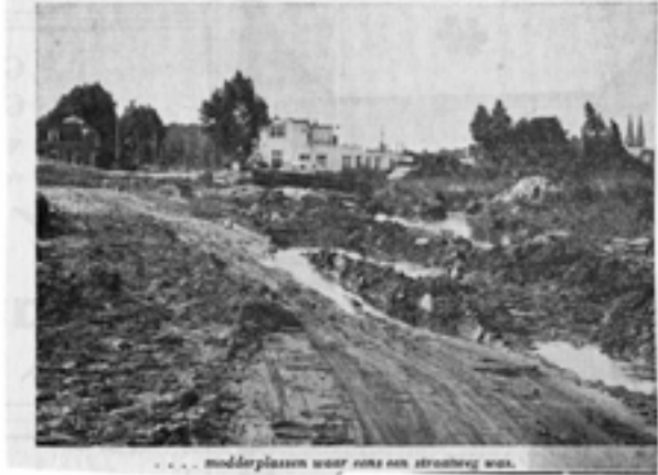
... modderplassen waar ons een straatweg was.

De inwoners van Duivendrecht blijft weinig of niets bespaard. Afbraak van panden terwijl de nieuwbouw maar niet op gang wil komen, wateroverlast als gevolg van het bezwijken van spuitkaden en nu blokkering van het zuidelijk gedeelte van de Rijksstraatweg door grondverschuiving. „Het is om moedeloos van te worden”, verzuchtte een Duivendrechtster ons, „nou Duivendrecht dan toch zijn afgeleid van duivels drek?”