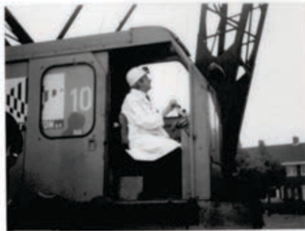
Eerste paal voor 'T SPUYTHUYS