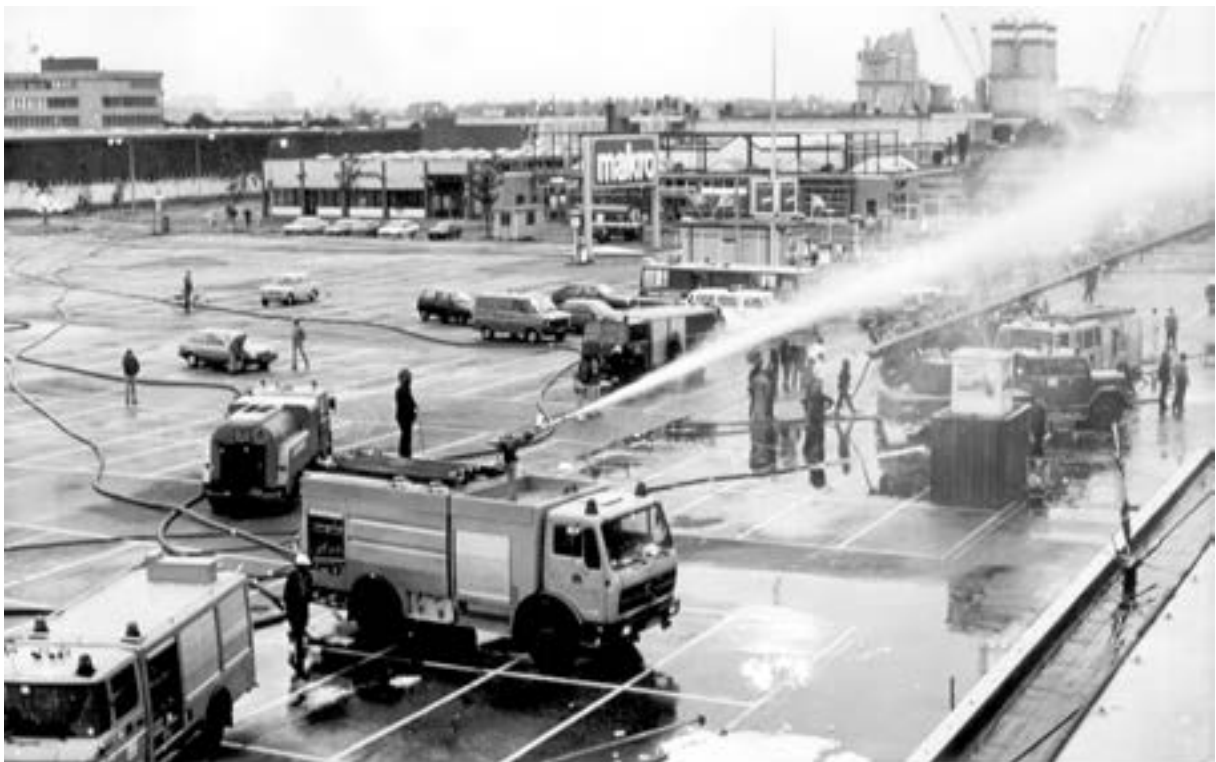
Bluswerkzaamheden op het Makro-terrein