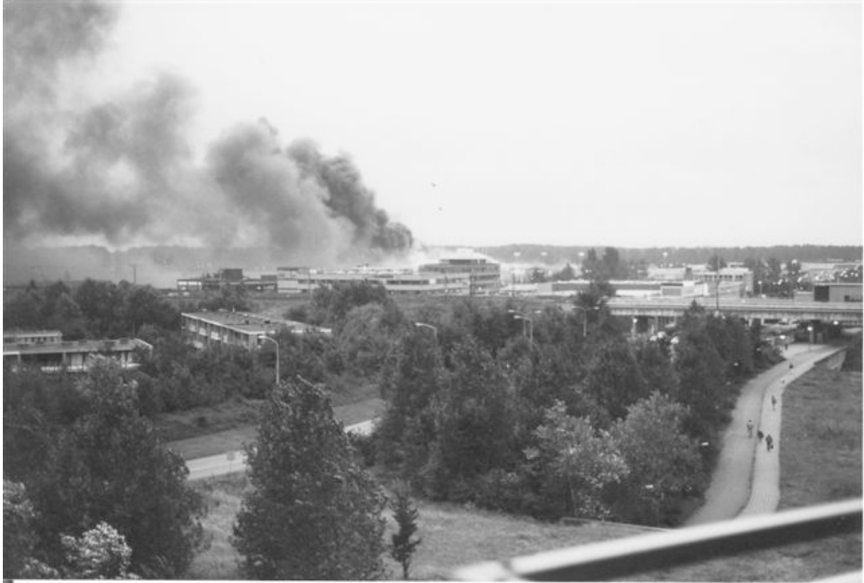
Makro-brand in de vroege ochtend vanuit zijn woning Neptunus 605