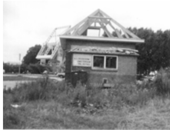
De oude brandweerkazerne aan de Molenkade werd gesloopt en een nieuw onderkomen (1979) betrokken.