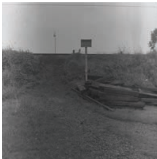
De oude onbewaakte spoorwegovergangen van de spoorlijn bij Duivendrecht