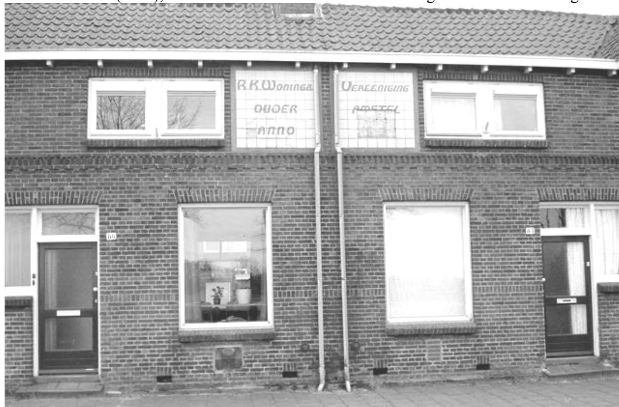
De woningen aan de Stramanweg anno 2009. Links nummer 86