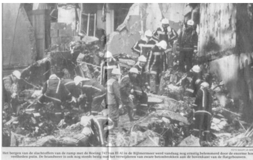
Het bergen van de slachtoffers van de ramp met de boeing 747 van El Al in de Rijnmermeer werd vandaag nog ernstig belemmerd door de enorme hoeveelheden puin. De brandweer is ook nog steeds bezig met het verwijderen van zware betonsbrokken aan de bovenkant van de flatgebouwen.

Toen Cor Wouda zondag 4 oktober 1992 om 18.35 u. zoveel sirenes bij zijn huis over de A10 hoorde gaan wist hij direct dat er iets ernstigs was en ging hij zo snel hij kon naar de kazerne om alles klaar te leggen. Bij Flierbosdreef werden er verschillende groepen samengesteld. Er moest bergen werk verzet worden. Ook landelijk was het Duivendrechtse korps actief zoals bij de vuurwerkcramp in Enschede. En bij de Cindu-ramp in Uithoorn.