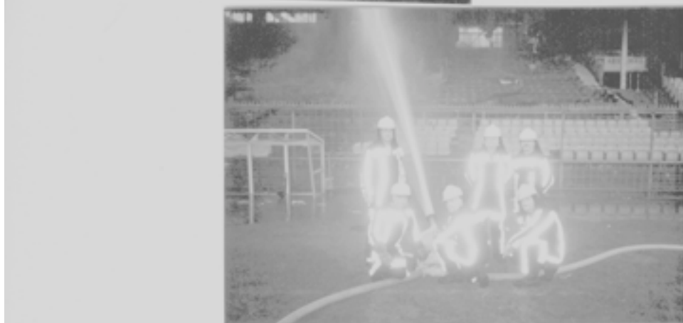
Geblust door de brandweerlieden van post Duivendrecht