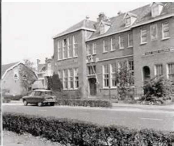
De Zusters van “De Voorzienigheid” voor de ingang van hun klooster Soli Deo Gloria. Rechts op de rechterfoto het klooster nr.235 en daarnaast links de St. Joanneschool nr.233