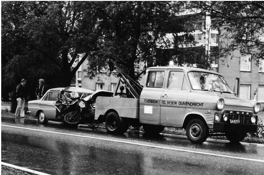
Bergingswerkzaamheden aan de Burg. Stramanweg in Ouderkerk