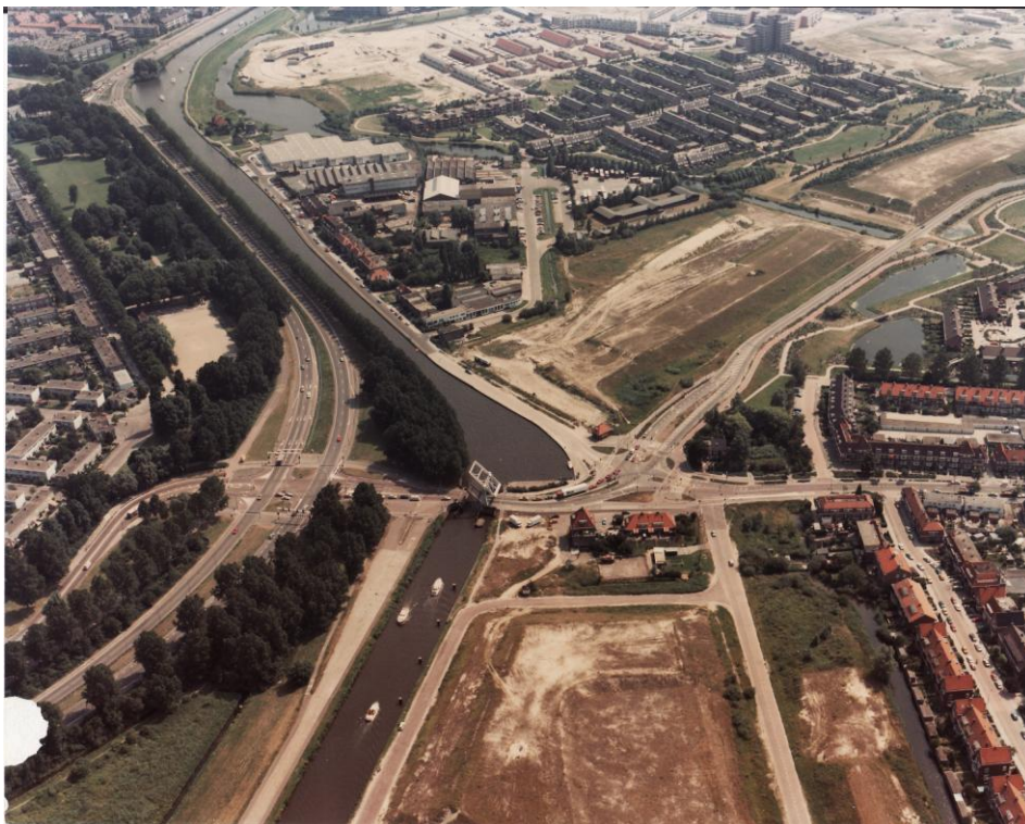
Betondorp, Weespertrekvaart, Duivendrechtsebrug, Molenkade, Rijksweg Noord, Kloosterstraat, Berkenstraat, Populierstraat