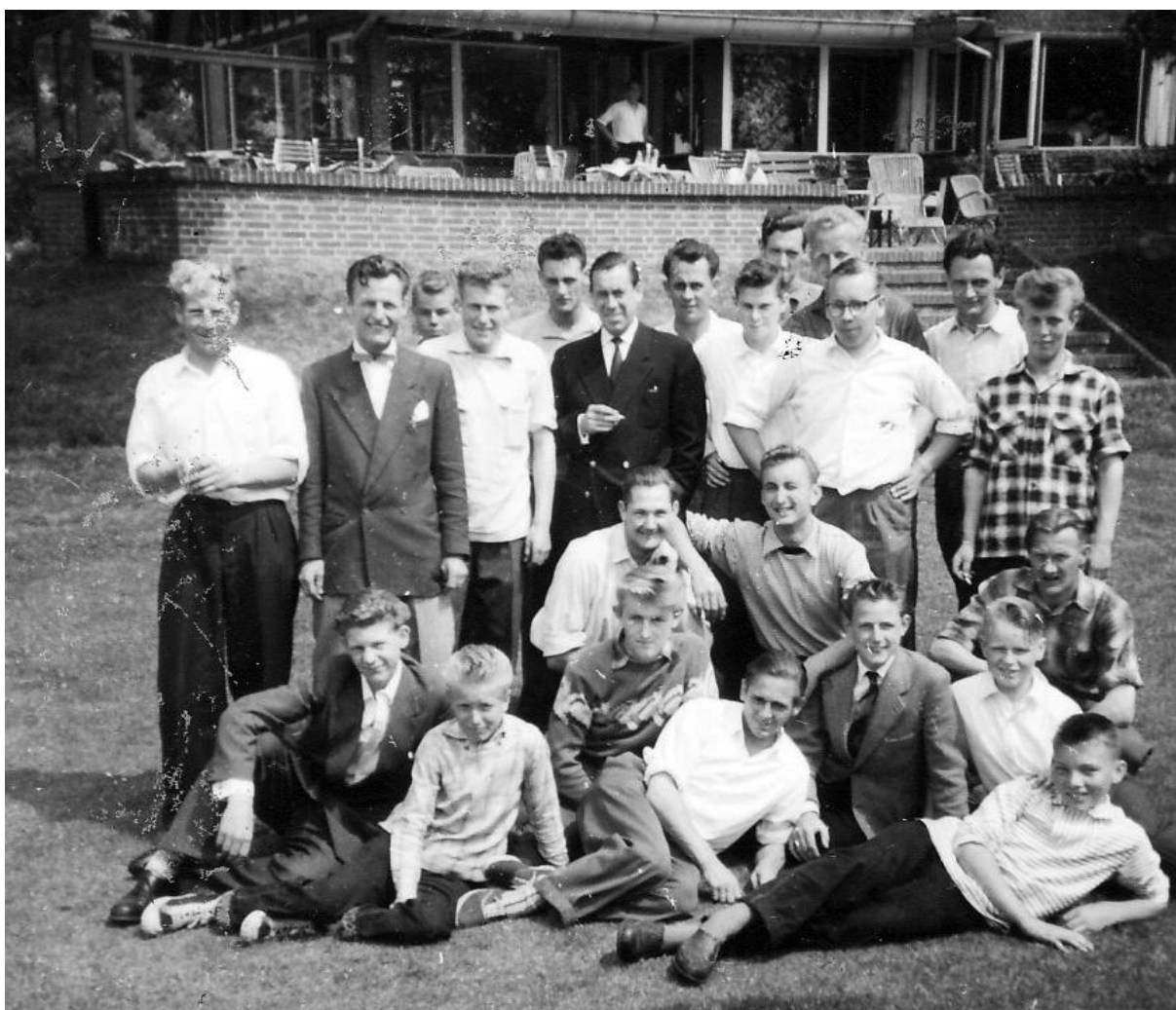
Caddies voor het clubhuis van de AGC 1954