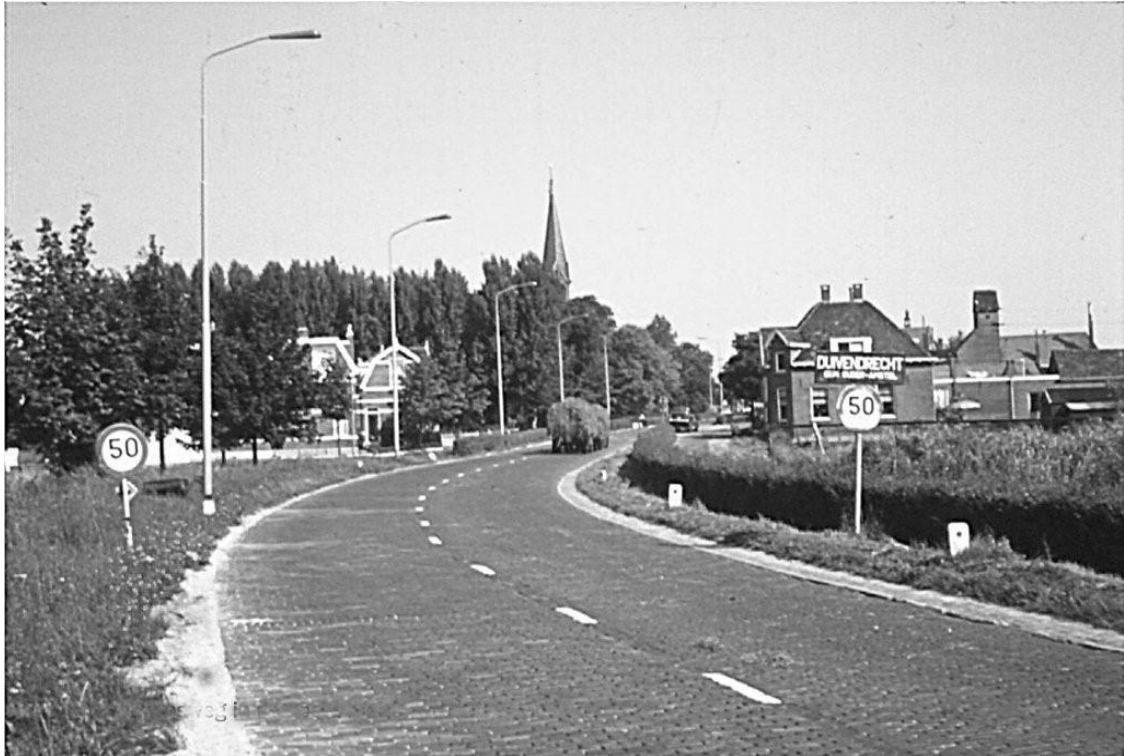
Aan het einde van de Rijksstraatweg in Duivendrecht-Zuid lag na de bocht - in het door de ontwikkeling van de Bijlmer “geamputeerde deel” van het dorp - rechts eerst het huis van veevoerhandelaar Snel, daarnaast slagerij Van Walbeek, Verberkt en sigarenmagazijn Fakkeldij.