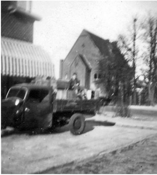
Deze open ventwagen was een Goliath