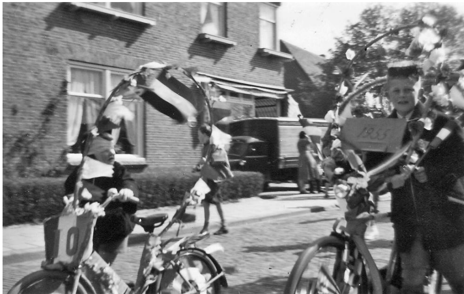
In mei 1955 vierden wij in het dorp de 10-jarige bevrijding met versierde fietsen. Met mijn suikerbiet (dit was het voedsel in de Hongerwinter) won ik de eerste prijs. Op deze foto sta ik met mijn fiets voor de zaak in de Korenbloemstraat.