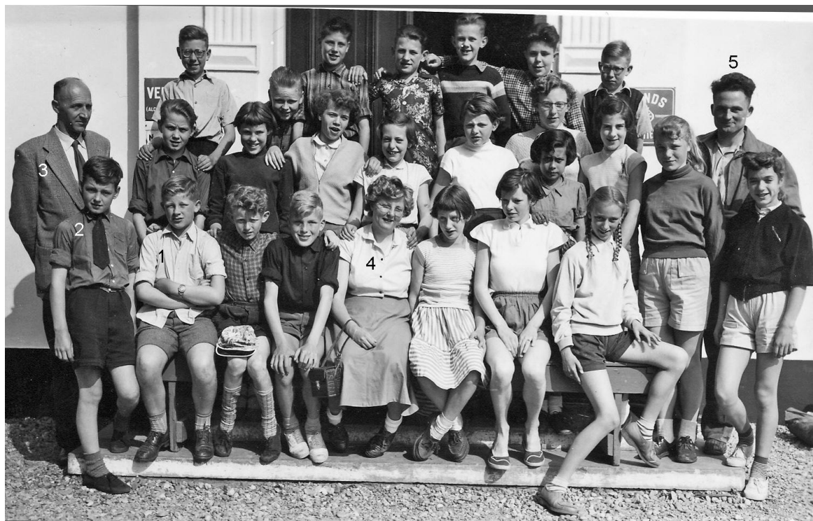
Meerdaagse schoolreis Ellecom 1955