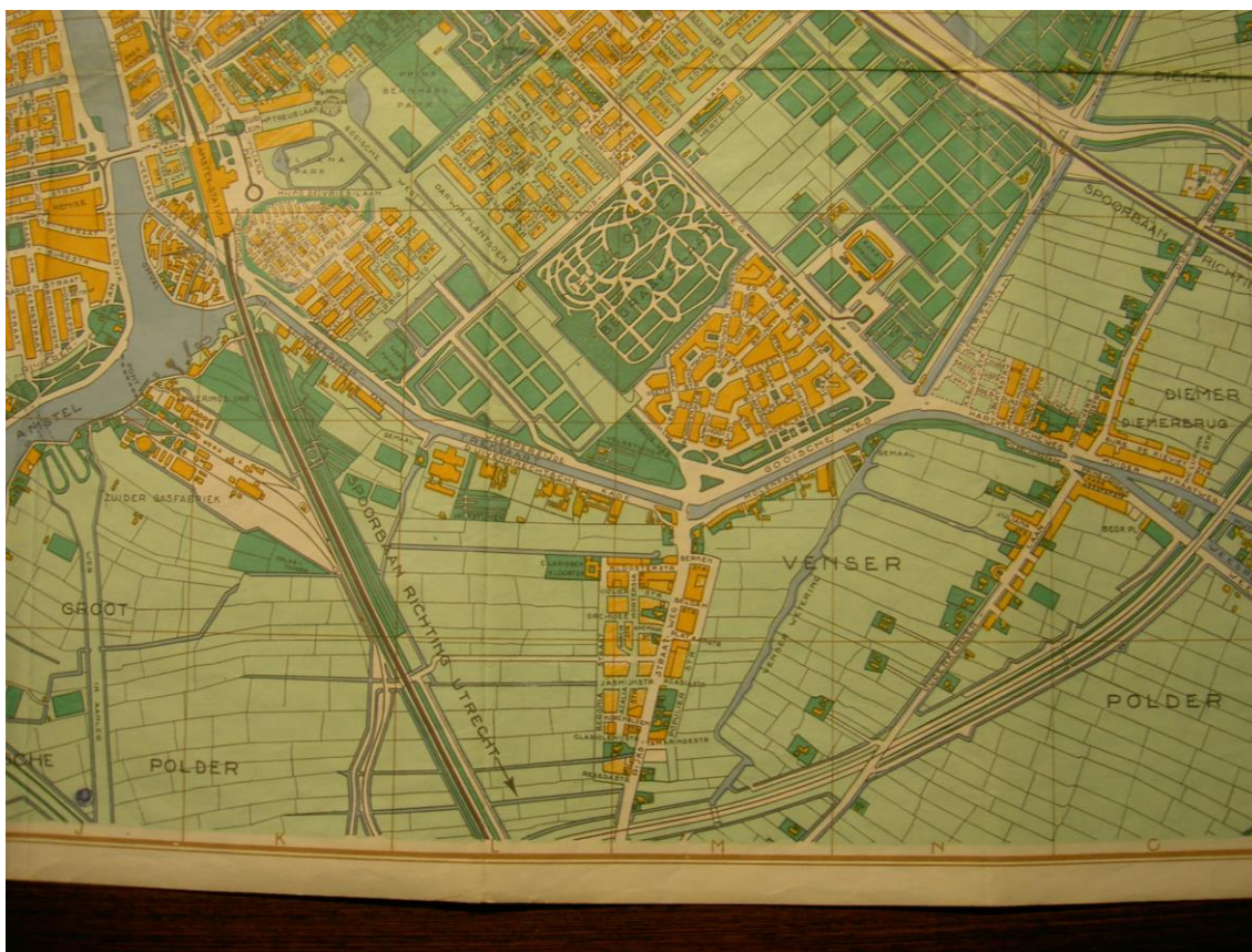
2. Kaart van Duivendrecht uit 1930

Tijdens het interbellum was er in Amsterdam een hevig tekort ontstaan aan woningen en daar werd driftig gebouwd. Toch was deze bouwwoede niet voldoende om alle mensen in Amsterdam naar vrede te kunnen huisvesten. Daarom waren er door de stad vast maatregelen genomen om ook nog in de toekomst uit te kunnen breiden. Een groot gedeelte van het omliggende land werd in 1921 geannexeerd, zodat in de nieuw aangeworven gebieden grootschalige stadsuitbreidingen zouden kunnen plaatsvinden. Onder deze annexatie viel ook gebied van de gemeente Ouderamstel: de industriehoek bij de Omval en de Duivendrechtse kade, de kade die vanaf de Omval langs de Weespretrekvaart liep. Hierdoor kwam Amsterdam vlak naast de bewoning van Duivendrecht te liggen. Natuurlijk stonden sommige omliggende gemeenten, inclusief Ouderamstel, niet te juichen bij deze gebiedsafstand. De annexatie werd gezien als het 'ten prooi geven van de echt nationale beschaving onzer dorpen aan de hebzucht van een bedorven, door internationale dwaalleren verwaasde stad'. 10 Toch wist Amsterdam te overtuigen door te wijzen op het nijpende woningtekort en de moderne eisen die gesteld zouden moeten worden aan grootschalige uitbreidingen, zoals een doordachte planning van nieuwe verkeerswegen en treinverbindingen.