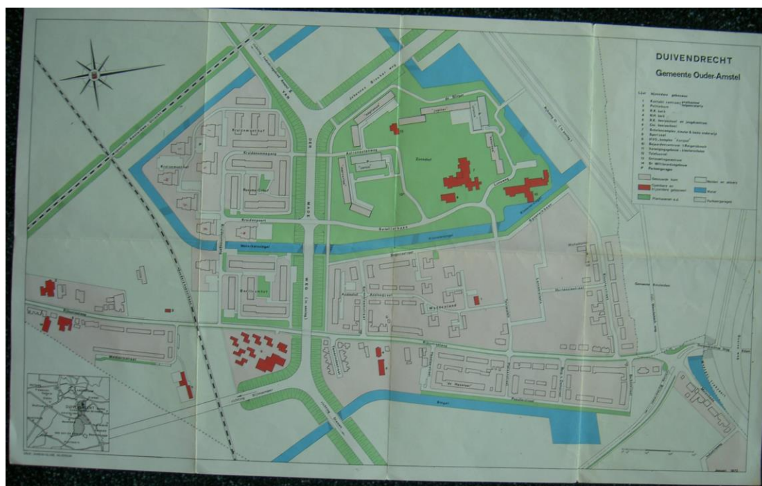
Kaart van Duivendrecht, 1973.

Ook al was het totaalplan voor 10.000 bewoners gesneuveld, delen van het plan kwamen wel tot uitvoer. Dit is goed te zien op de kaart uit 1973, waar de in aanbouw zijnde gebouwen al zijn ingetekend.