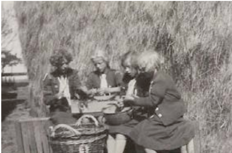
Tijdens gidsenkamp 1952 Worteltjes krabben voor de avondmaaltijd