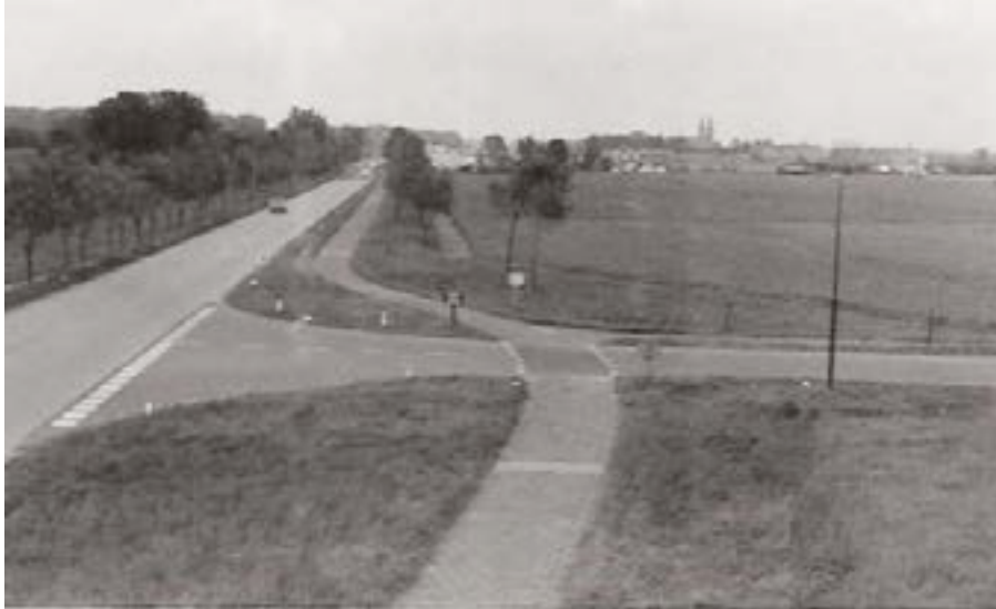
Gezicht vanuit het zuiden op Duivendrecht met de 2 karakteristieke torens van de RK Sint Urbanuskerk

opwaaien. De vuilnisbakken waren nog niet gestandaardiseerd, dus van alle soorten en maten. Het was zwaar en vervelend werk: de bakken moesten worden opgetild tot ongeveer borsthoogte, dan boven de bak worden omgekeerd. Door met de bak op de rand van het schot te slaan werd het vastzittende vuil alsnog in de kar gelost. Het huisvuil werd naar de belt gebracht voorbij de RK kerk.