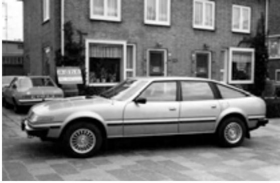
Nog zonder naam