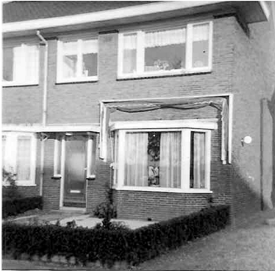
DE 2 JANNEN Rijksstraatweg 103 zónder naam en mét naam