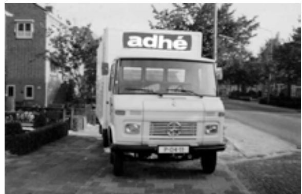
Rijksstraatweg 40 Duivendrecht