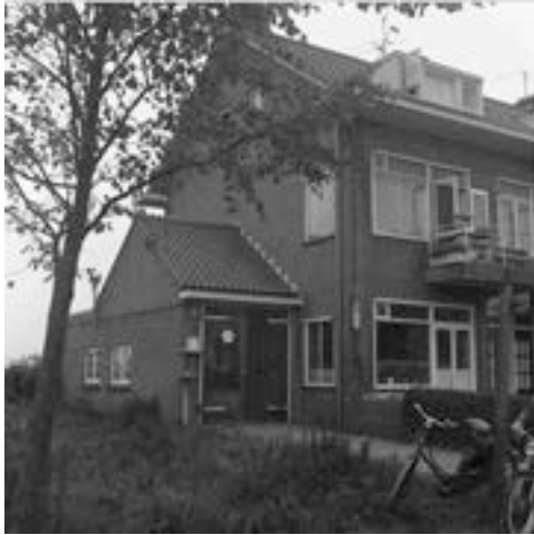
Postkantoorje bij Rijksstraatweg 50

In de jaren zestig was het Duivendrechtse postkantoorje onder beheer van mevrouw Eijk, de moeder van de huidige bisschop van Groningen. Gewoon in een woonhuis in de buurt van Lotgenoten. Later verhuisde het postkantoor naar de ruimte waar voorheen het wasgoed van de wasserij gesorteerd werd.