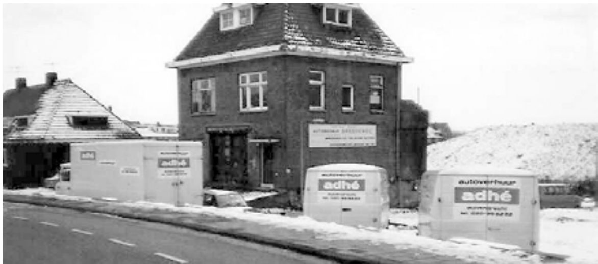
Ook aan de Duivendrechtsekade stonden auto's van Adhé geparkeerd.