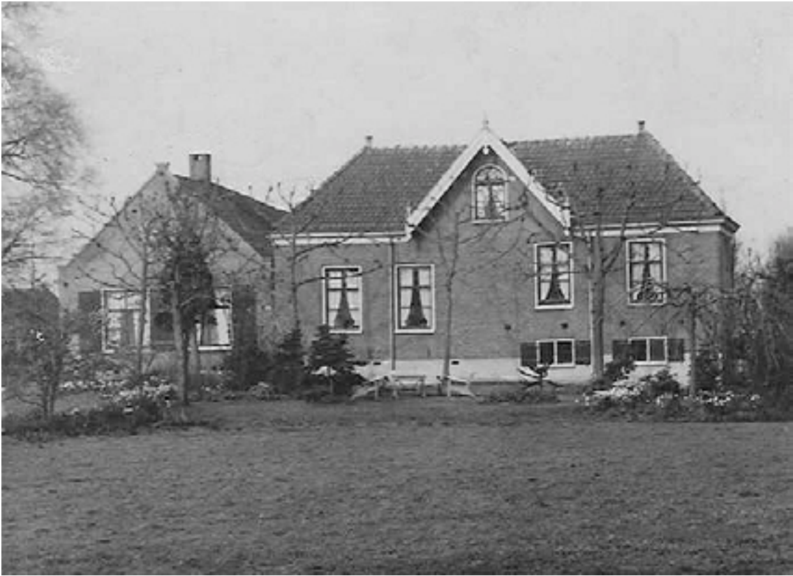
Goed Genoegen. Rijksstraatweg 125. Familie Vrolijk. Afgebroken 1967