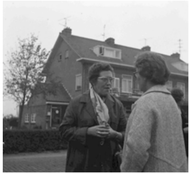
Consternatie rond de “overval” op het postkantoor aan de Rijksweg bij nummer 50