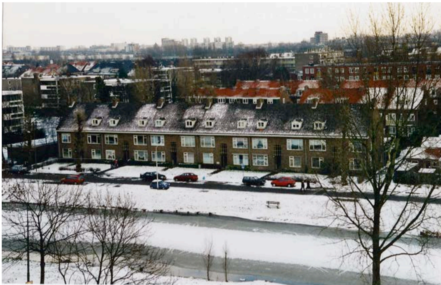
Begoniastraat 41- 58