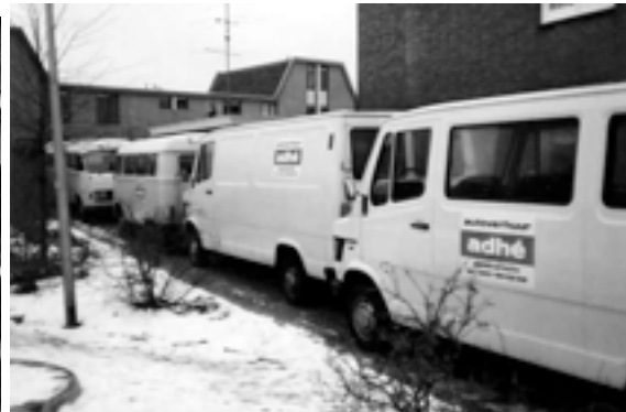
Veel busjes te huur