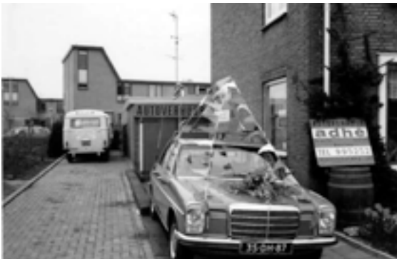
Versierde personenwagen op Koninginnedag