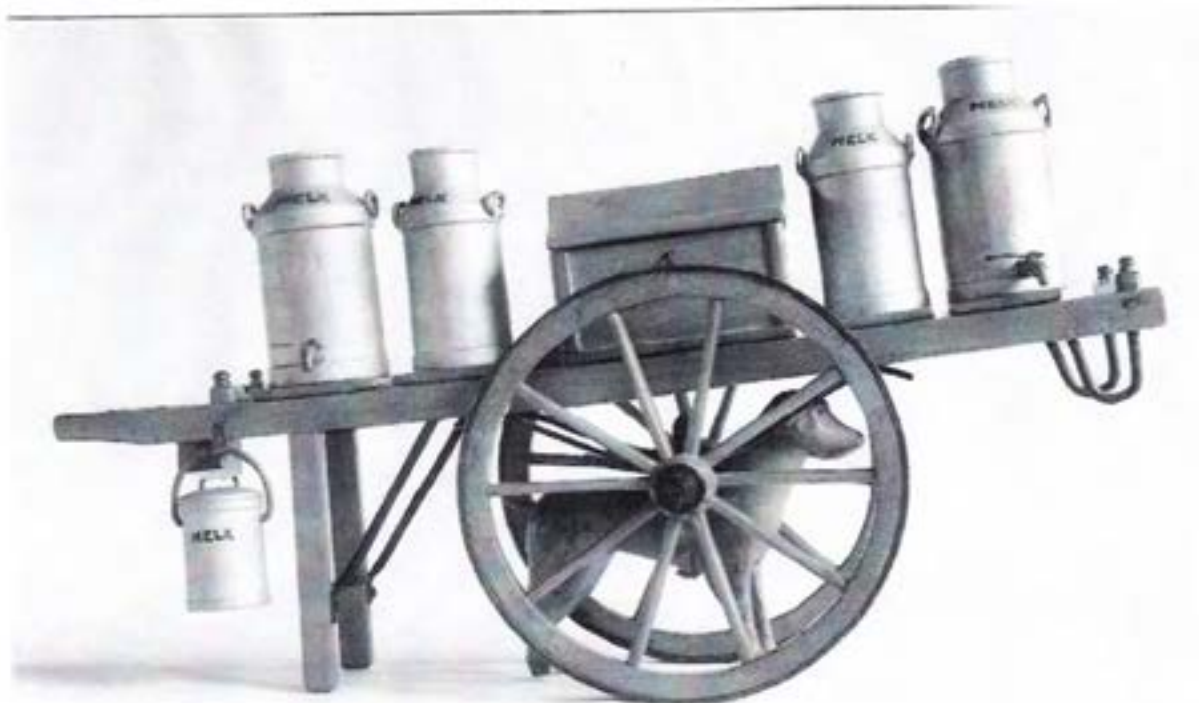
Replica van een hondenkar