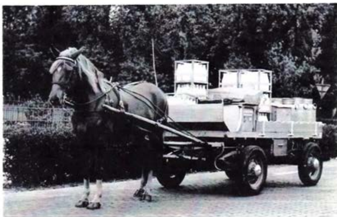
“Het paard kende de route”