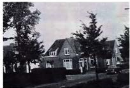
was E 21 X later nummer 27

Uit de onnummering van de gemeente Ouder - Amstel, per 31 december 1926 blijkt: