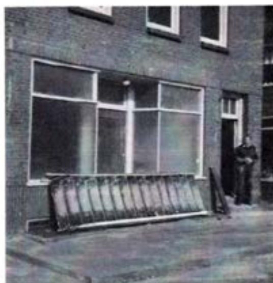
Van winkel tot woonhuis