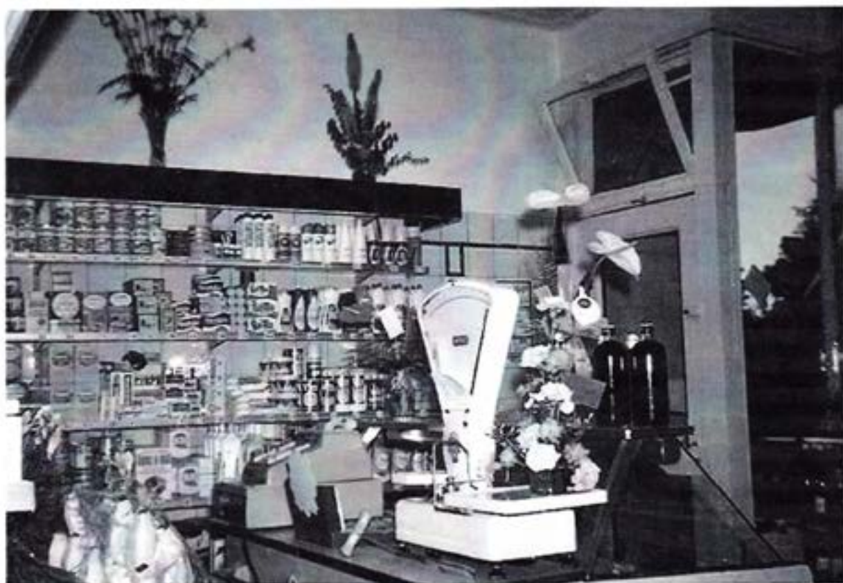
Het uitgebreide assortiment