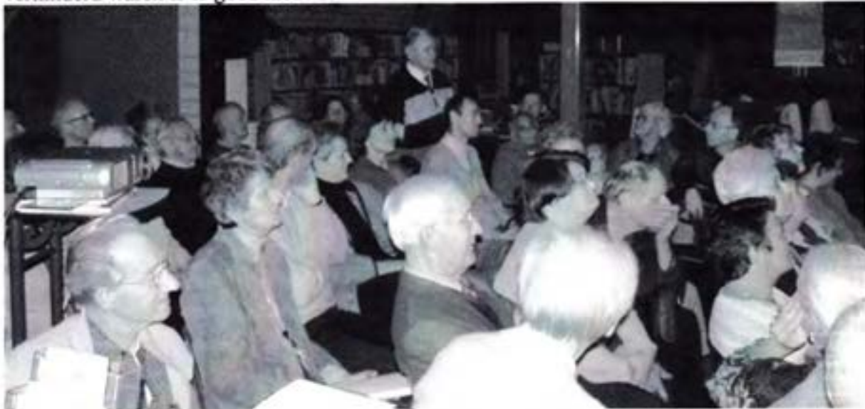
De bibliotheek te Duivendrecht 18 november 2004 bij de beamerpresentatie.

De beamerpresentatie Nieuwe Beelden van het Oude Duivendrecht van B.P.Hess was een enorm succes. Voor onze abonnees en de andere mensen, geïnteresseerd in de historie van Duivendrecht, die op 18 november jl. geen plaats konden krijgen in de bibliotheek op het Dorpsplein én voor de mensen die de aankondiging gemist hebben of die deze avond verhinderd waren is er goed nieuws: