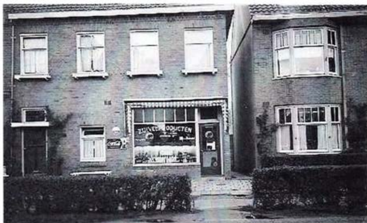
Van Schaick exterieur