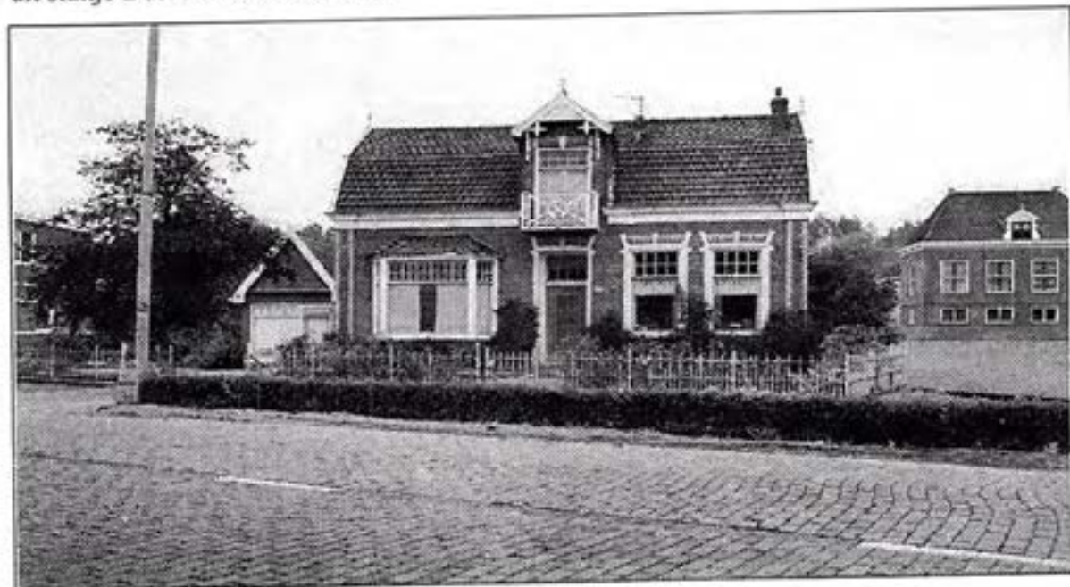
Rijksstraatweg 112 Beukeboom en het prachtige Strandvliet rechts.

Met de komst van de Bijlmer was Teun de eerste, die in de bouwketen en in de eerste flats met een daartoe speciaal geconstrueerd wagentje zuivel leverde. Hij kon zo tot in de flats komen. Klaas van der Vaart deed later ook mee. Op den duur was dat niet meer te doen. Vanwege de herinrichting van het hele gebied rond Duivendrecht ten behoeve van de infrastructuur, was ook de winkel van Teun Beukeboom gedoemd te verdwijnen. Steeds verder rukten de zandheuvelds op en verscheen een dijk aan de horizon. De Bijlmerringkade, net als de gemeente Weesperkarspel werden opgeslokt in een nieuwe Amsterdamse woonwijk. Vlak voor de sloop van het buurtje stopten de Beukebooms ermee. Het prachtige Strandvliet viel ten offer en zo het hele oude vertrouwde buurtje aldaar, inclusief de winkel van slager Van Walbeek, het Paxgebouw en de Sint Joannesschool. Sinds de jaren zeventig bestaat ook dit stukje Duivendrecht niet meer.