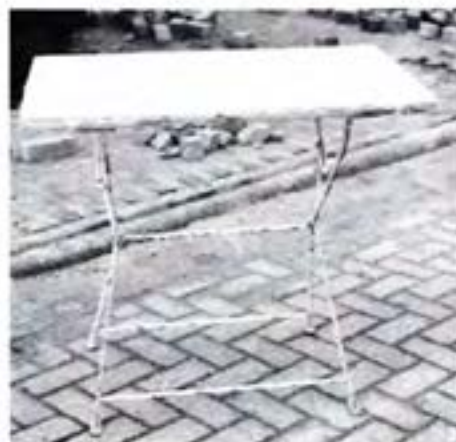
Het enig overgebleven tafeltje van de melksalon.

Annie zette de zaak voort en behaalde allerlei vakdiploma's tot en met glas en keramiek. In 1969 nam haar zus Roos de winkel over tot de afbraak in 1972. Samen met de boerderij van Vrolijk en de zuidzijde van de Tamarindestraat moest dit oude stukje Duivendrecht wijken voor de Van der Madeweg. Duivendrecht verloor een markant winkeltje waar je van alles kon kopen: ondergoed tot en met een mooie vaas, die je cadeau wilde geven; sokken tot en met zakdoeken, enzovoort: een charmante "winkel van Sinkel".