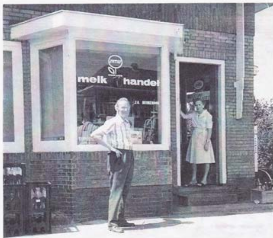
De sluiting van de zaak 15 juli 1976