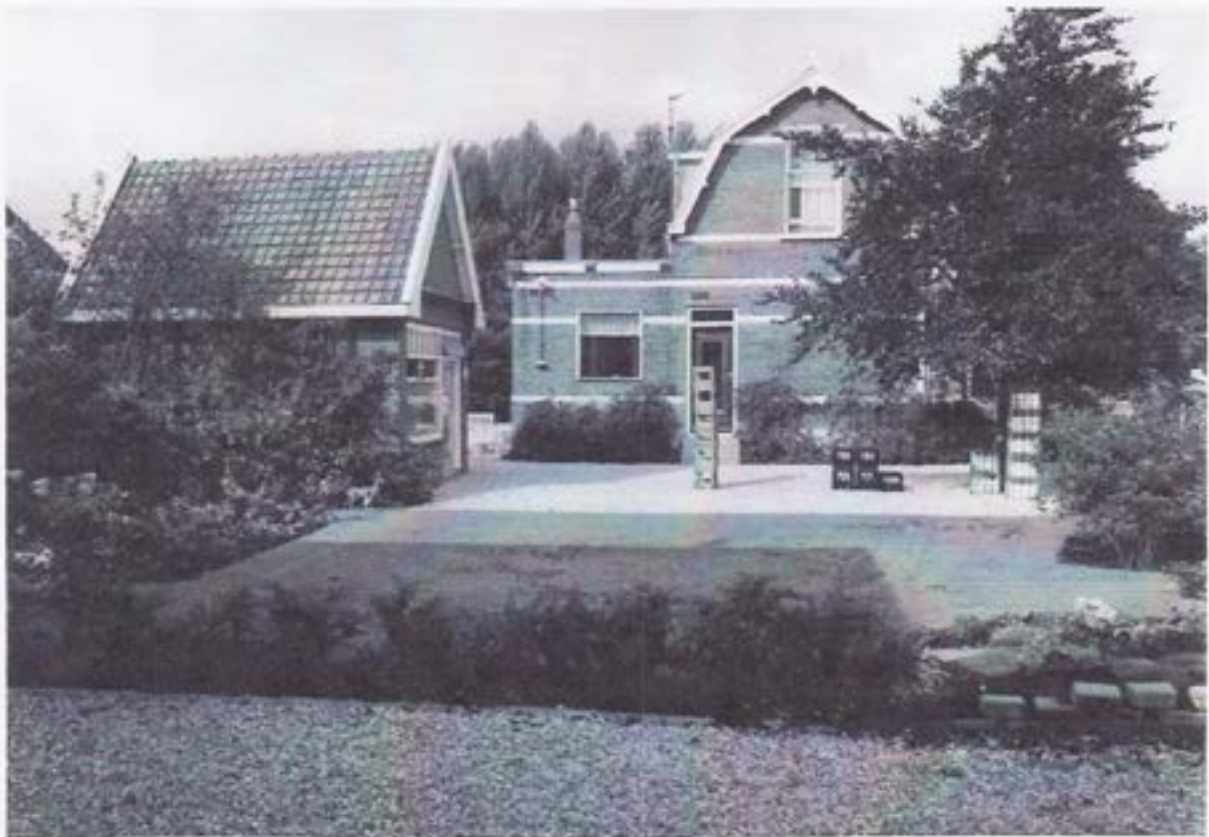
Bedrijf en woonhuis