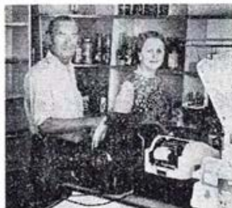
Een liter melk 8 cent