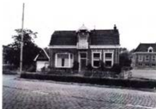
Oude nummering Nummer 112