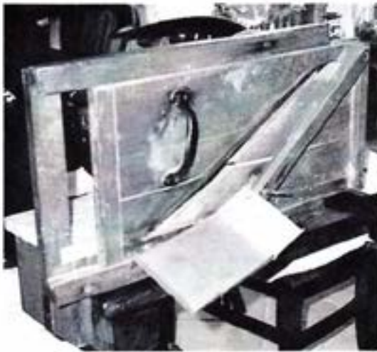
Voor keurige plakjes