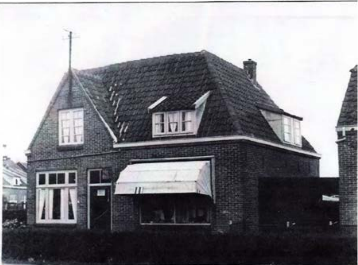
Op de linkerhoek was ooit de melksalon en waar de luifel uithangt de winkel

Uit de omnummering van de gemeente Ouder-Amstel, per 31 december 1926 blijkt: De Nieuwstraat werd oorspronkelijk de 3 e dwarsstraat van de Rijksstraatweg te Duivendrecht genoemd. Op de hoek was het perceel van J.A. van der Kroon. Dat was nummer E 21 X en werd toen Rijksstraatweg 27. In de loop der tijden werden weer andere nummers, maar ook namen ingevoerd, bijvoorbeeld de Spoorstraat werd Korenbloemstraat en de Nieuwstraat werd Tamarindestraat. Links zijn nog een paar huisjes uit de Tamarindestraat te zien, die in 2003 ook afgebroken zijn.