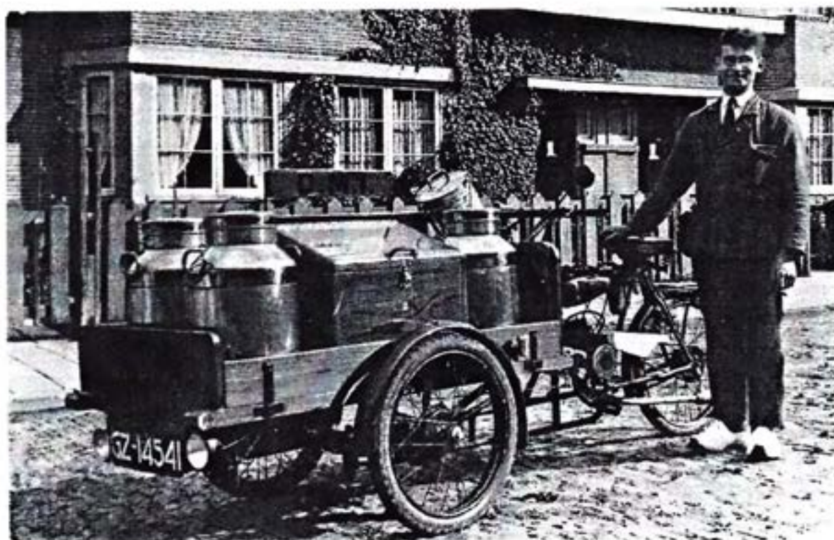
Jaap Beukeboom in de Kloosterstraat 1944