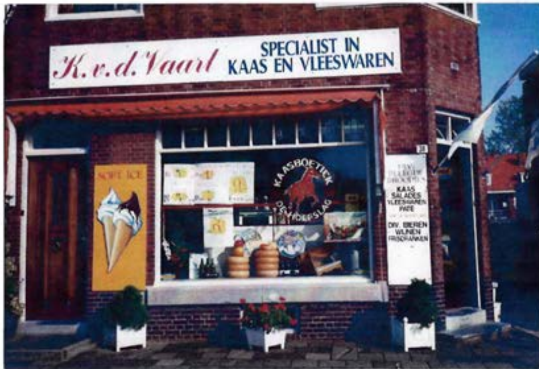
Sluiting van de boetiek in 1991, één maand na het 65-jarig bestaan