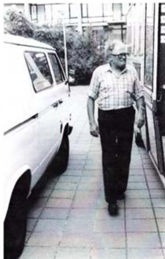
Bezorgen in de Kruidenbuurt