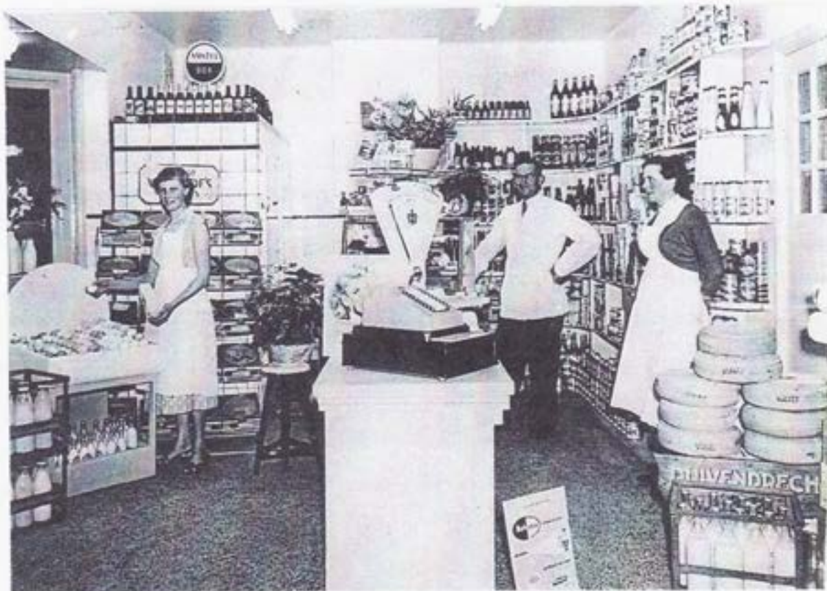
Na de verbouwing 1957