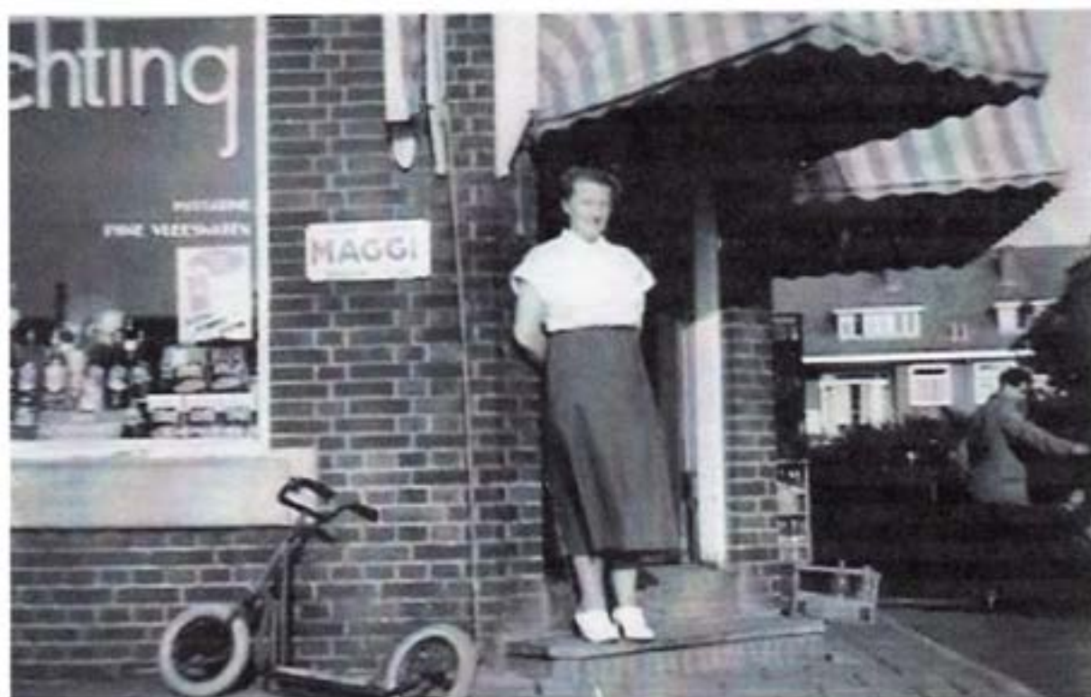
Moeder van der Vaart – Rijpkema