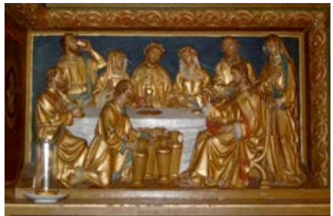
DE BRUILOFT TE KANA