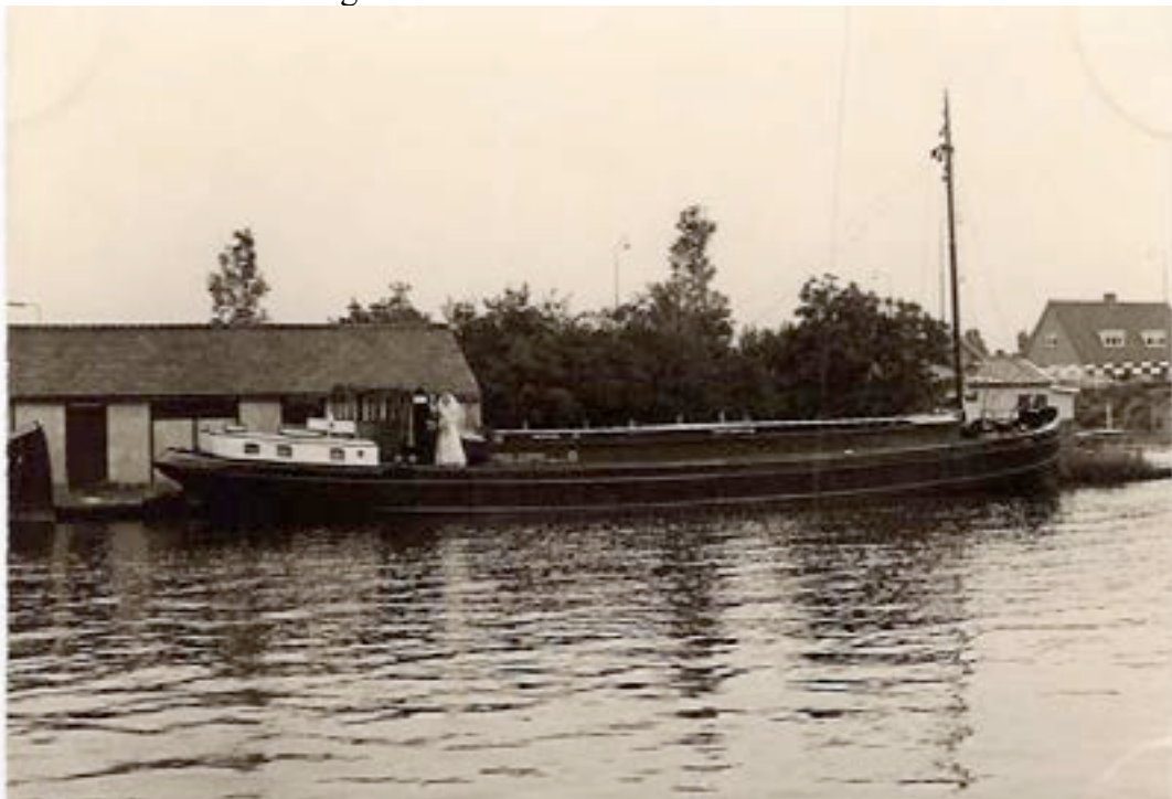
De huwelijksboot MS Catharina, gelegen bij v.d. Velde in Ouderkerk a/d Amstel