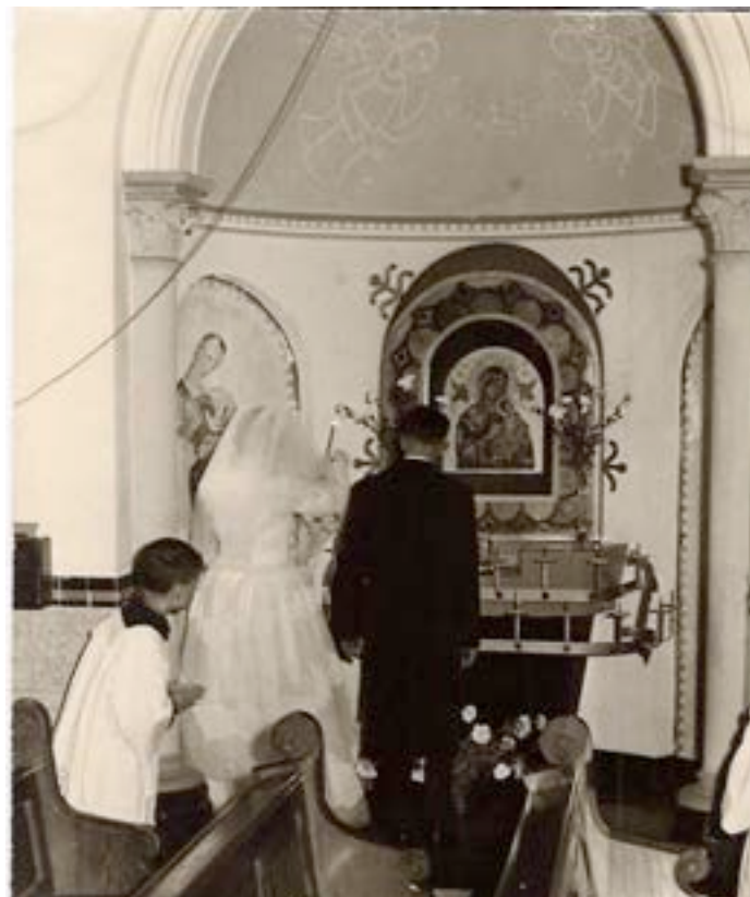
MARIAKAPEL IN 1962 De schildering in de koepel is nu verdwenen