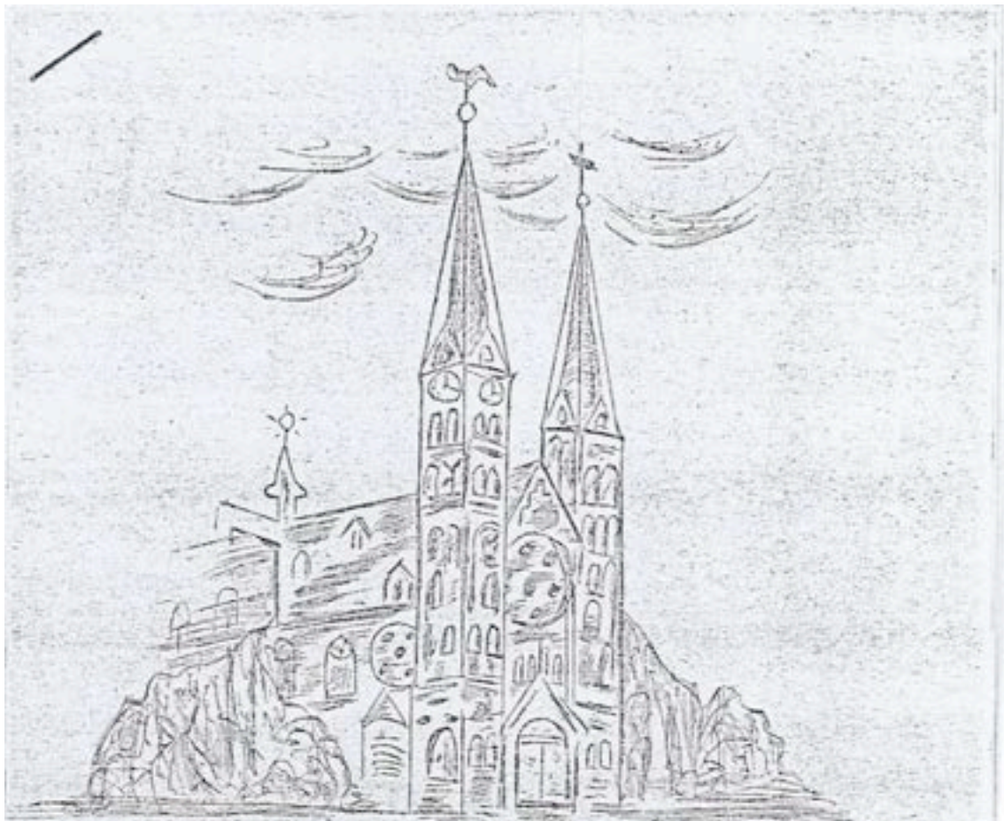
Sint Urbanuskerk - Duivendrecht