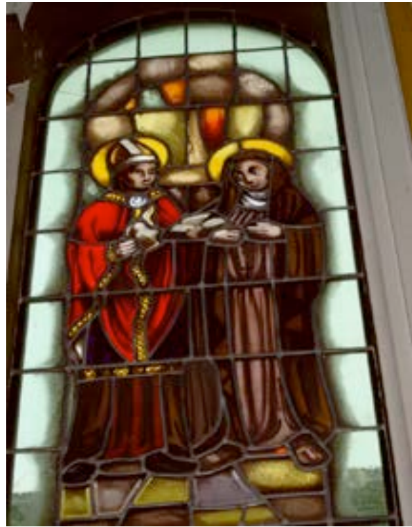
S. AUGUSTINUS en S. MONICA