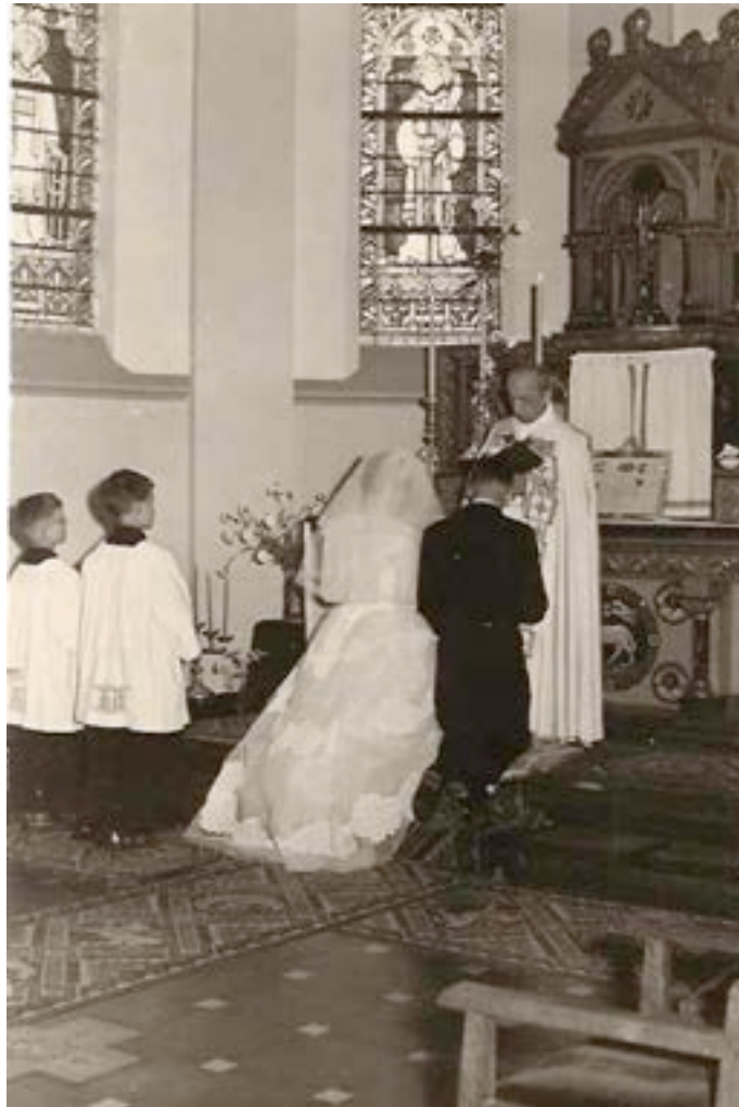
HET PRIESTERKOOR MET ST.URBANUSRAAM