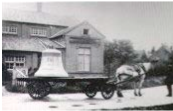
Vervoer van de klokken door Petit & Fritsen uit Aarle – Rixtel.