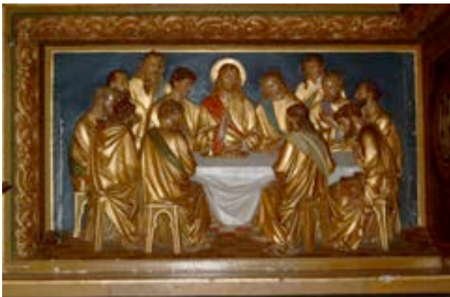
HET LAATSTE AVONDMAAL