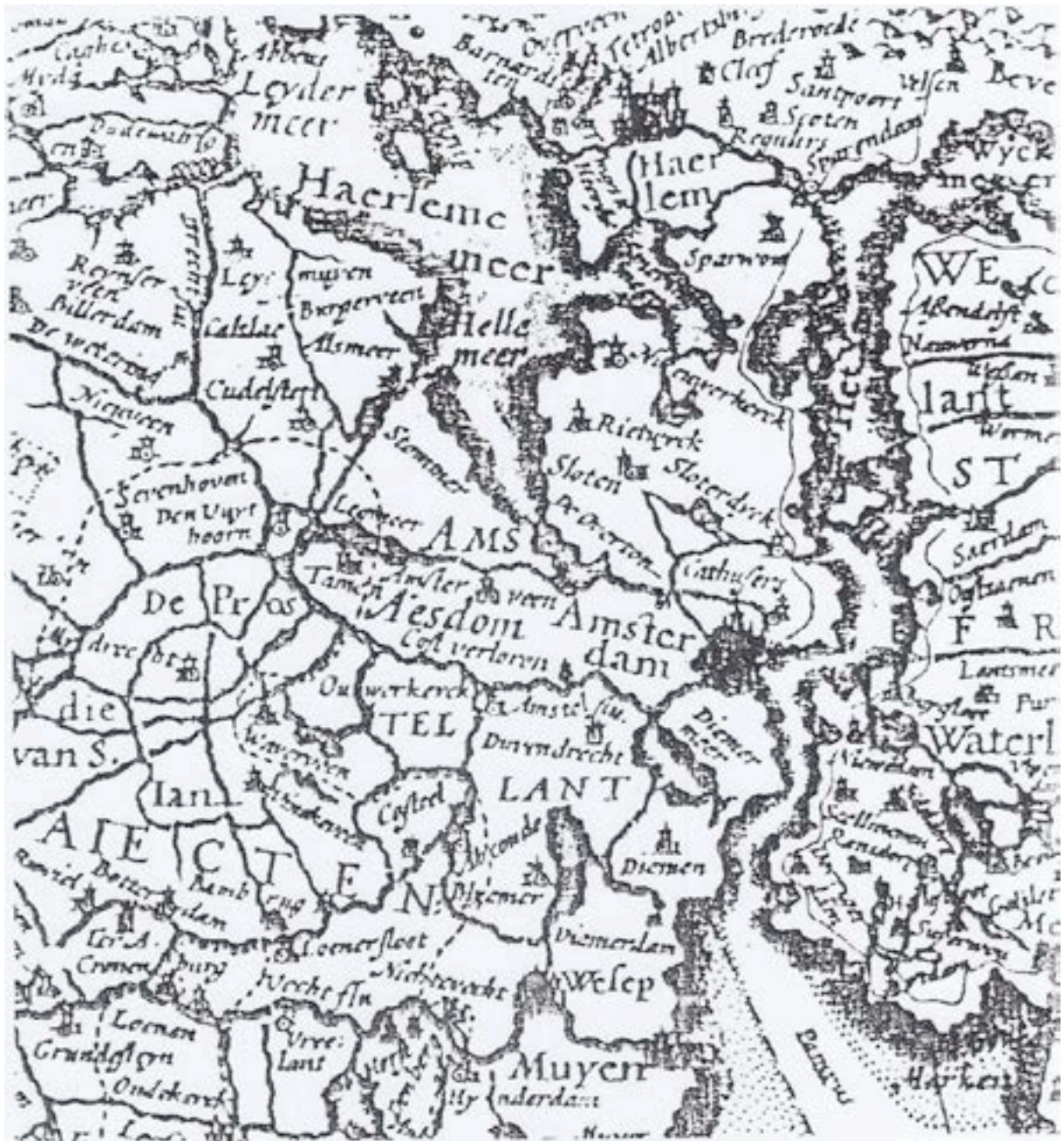
KAART VAN WILLEM J. BLAEU 1608