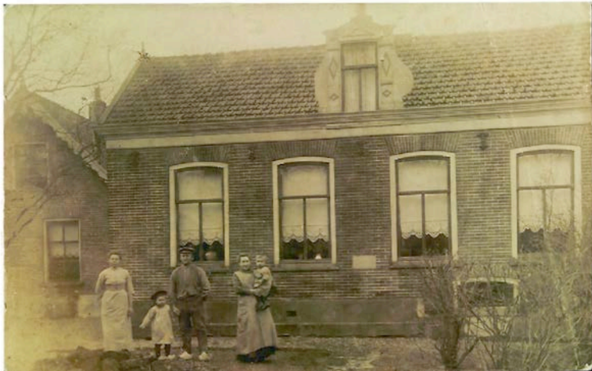
Foto: 1917 Voor de Sophia'shoeve